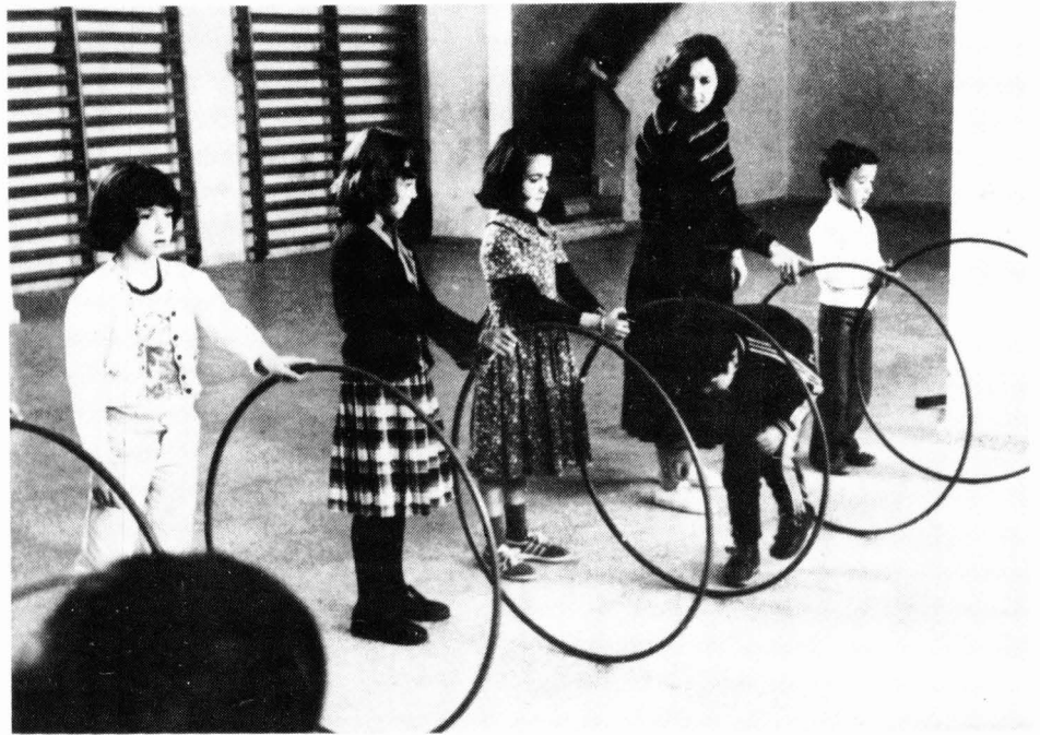
Taller de psicomotricitat

Als grups de nivell de maduresa més baix les sessions del matí comencen amb la projecció d'una pel·lícula didàctica, que té un paper fonamentalment motivador i que es considera important a l'hora dels resultats obtinguts.