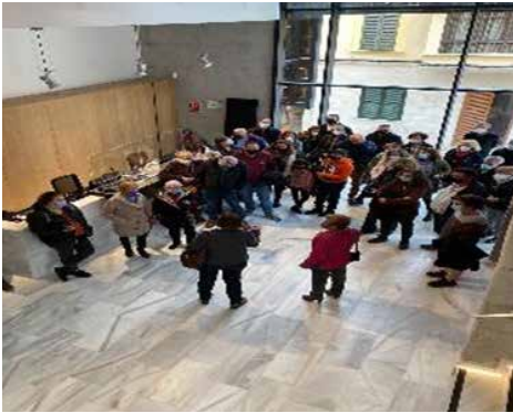
Figura 1. Visites guiades (14, 15, 20, 21, 22, 27, 28 i 29 de novembre de 2021).

Així ho indicava un dels objectius fundacionals del Patronat, dotar Inca d'un centre promotor, organitzador, difusor i patrocinador de qualsevol mena d'activitat o exhibició que fomenti el desenvolupament de les arts escèniques en general. No obstant això, cal assenyalar que ja feia menció el document que