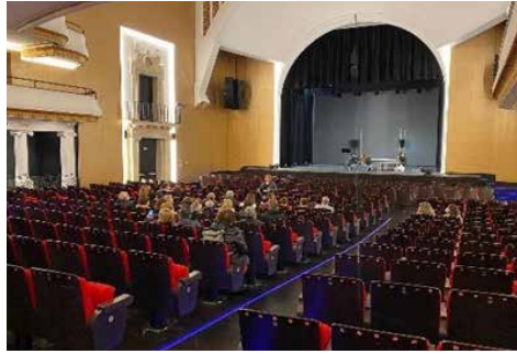
Figura 2. Visites guiades (14, 15, 20, 21, 22, 27, 28 i 29 de novembre de 2021.

les institucions de caràcter cultural, els estudis actuals incentiven aquest tipus d'activitats i la recerca de millores i innovacions; una visió que defensa l'obertura dels espais com a llocs de convivència, i en què una de les consignes més reivindicades és fonamentar un rol d'agent actiu al públic en la seva transformació, evolució i refundació.