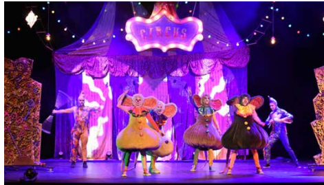
Figura 10. Dumbo . El musical. 20 de novembre de 2022.