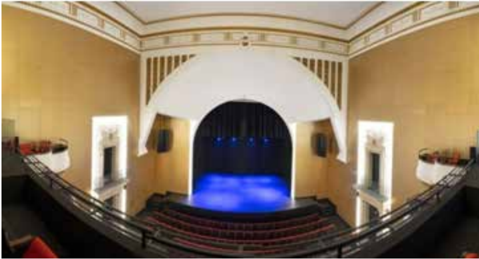
Figura 15. Sala principal.