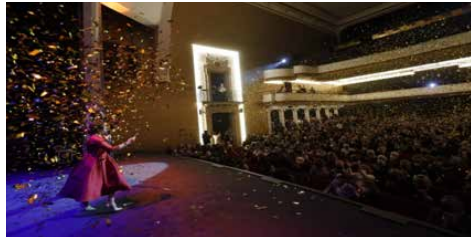
Figura 3. Gala d'inauguració el 16 de desembre de 2021.

La tarda del dijous dia 16 de desembre va ser la carta de presentació davant el públic i les autoritats públiques, amb la celebració de la gala inaugural del recentment renovat Teatre Principal d'Inca. L'acte va conjugar espectacles de teatre, música i humor amb un repàs de la història centenària de la sala; un testimoni dels records que han format part de molts ciutadans i de la institució que han lluitat per la seva recuperació com una conquesta emocional, cultural, social i econòmica del municipi.