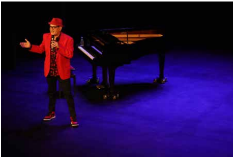
Figura 5. José Corbacho, Ante todo mucha calma . Teatre. 17 de novembre de 2021.

Al mateix temps, el Teatre Principal d'Inca ha anat oferint diferents tipologies d'esdeveniments culturals i artístics, entre els quals destaquen el teatre i la dansa; la primera activitat programada dins de la seva agenda cultural fou l'obra de teatre Ante todo mucha calma , de José Corbacho, el passat 17 de novembre del 2021, i també cal tenir en compte d'altres actes organitzats dins del calendari de la programació de la temporada 2021-2022, que a continuació s'il·lustren a tall d'exemple: