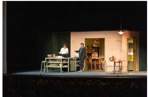
Figura 6. Cesc Gay. 53 diumenges . Teatre. 5 de desembre de 2021.