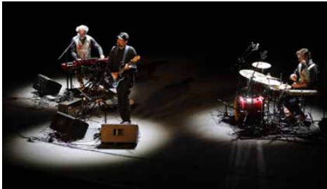
Figura 9. Joan Miquel Oliver. Concert. 23 d'abril de 2022.

Un altre aspecte important dins la labor de la programació del Teatre Principal d'Inca és la seva agenda musical, amb una rica, plural i diversa oferta de concerts de música de grups locals i nacionals, d'òpera i orquestres simfòniques, entre altres. Es presenta una amalgama qualitativa i quantitativa de les noves tendències musicals, i també de les grans produccions clàssiques del gènere. Es fa palpable l'excel·lent qualitat de l'espai després de la seva reforma i rehabilitació en termes de posada en escena, sonorització i acomodament.