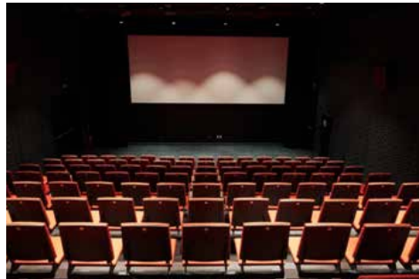
Figura 17. Sala annexa