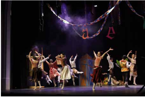
Figura 7. El flautista d'Hamelín . Dansa. 1 de març de 2022.