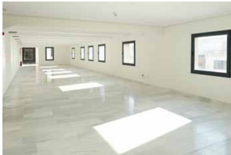
Figura 16. Espai polivalent.