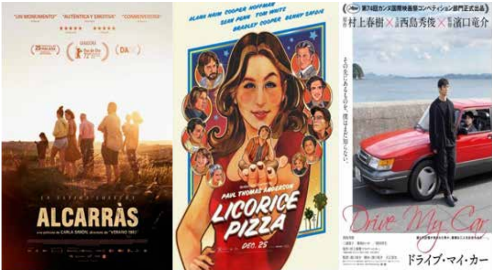
Figura 12. Carla Simón, Alcarràs (2022). 13 i 14 de maig de 2022. Paul Thomas Anderson, Licorice Pizza (2021). 10 de març de 2022. Ryūsuke Hamaguchi, Drive my car (2021). 31 de març de 2022.

Una de les grans demandes que hi havia en el conjunt del municipi era la necessitat de recuperar un espai de projecció cinematogràfica amb les últimes novetats de les estrenes nacionals i internacionals; una situació que, gràcies a la iniciativa del Teatre, ha permès gaudir de nou als habitants d'Inca d'una sala de consum filmic, ja que durant temps moltes generacions no varen tenir a la seva disposició aquesta oferta cultural dins el nostre municipi –i que s'havia de mobilitzar i acudir a la capital de l'illa o altres punts allunyats de la mateixa comunitat. Al llarg del curs s'han projectat diferents pel·lícules, des de les grans estrenes comercials fins a propostes més concordes al cinema d'autor més premiades.