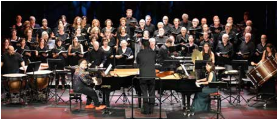
Figura 11. Carmina Burana de Carl Orff. 27è Festival d'Hivern. 23 d'octubre de 2022.