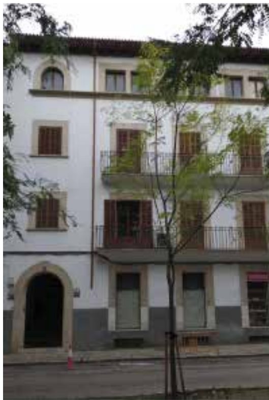
Figura 1. Façana de la Clínica Ferrer, situada a la Gran Via d'Inca.