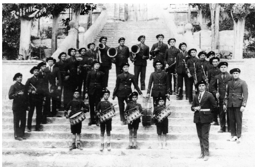
Figura 1. Banda de música de Selva, anomenada La Musa