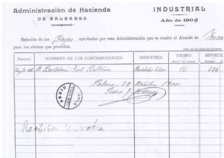
Altas y bajas en la contribución industrial