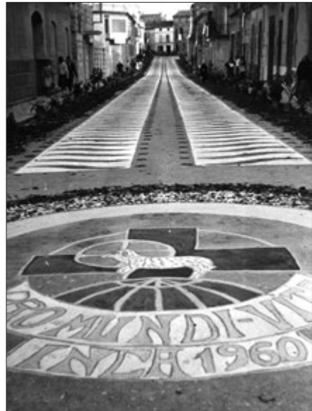
Estores de flors que engalanaven els carrers. La primera porta el lema del Congrés.