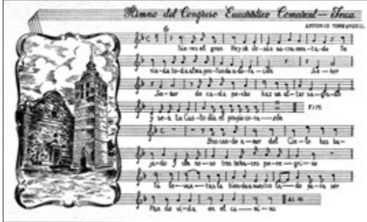
Partitura de l'himne del congrés.