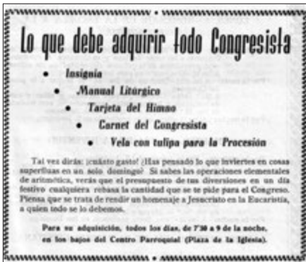
Bolleti del Congrés Eucarístic comarcal d'Inca.

Les dues exposicions foren molt visitades, igual que el calze il·luminat que presideix la façana de l'església parroquial.