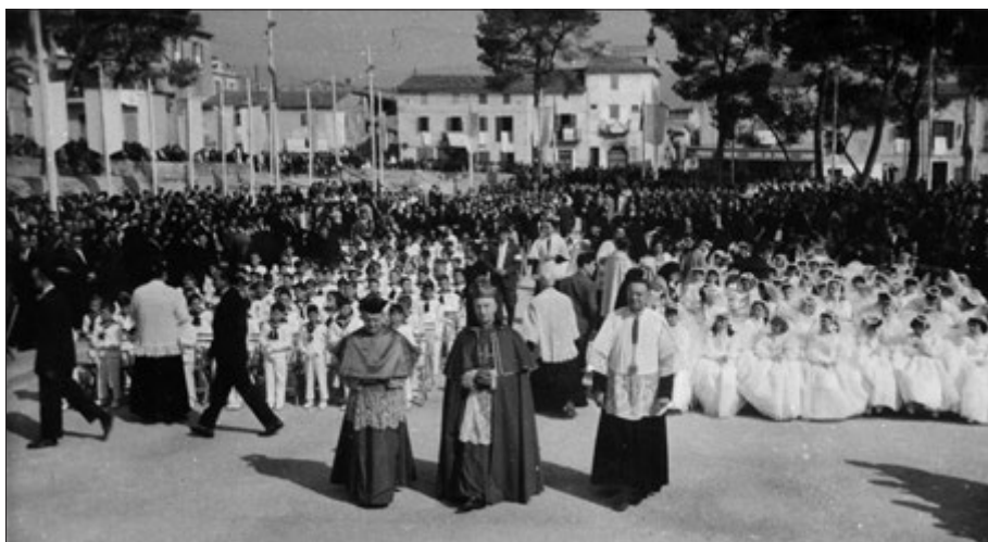
Primera comunió dels nins d'Inca i la comarca.