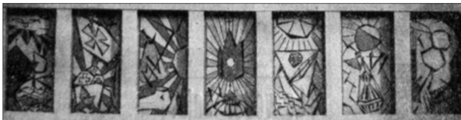
Detall de l'altar del congrés situat a la plaça de José Antonio.

Els dibuixos originals que representen els sacraments foren obra de Josep M a Grau i Montaner. El primer, el baptisme , representat per una pila baptismal dels primers temps, emmarcada pel passatge de l'Evangeli del baptisme de Jesús al Jordà. A la part superior es veu a l'Esperit Sant en forma de colom, amb aurèola de núvols. A sota i en primer pla, el riu Jordà i el peix, símbol eucarístic. La confirmació es resol amb una mitra episcopal i el miracle dels pans i els peixos. La penitència inclou la bossa dels doblers de Judes, un peu encadenat, un objecte que imita una creu i mitja espasa, i l'hòstia en forma de sol irradiant la seva llum sobre tots els símbols. El quart plafó representa l' eucaristia , en una gran custòdia que presideix el món, al·legoria del regnat de Crist i imatge del lema del Congrés. L' extramunció ve expressada en una barca de veles desplegadas, com l'ànima va unguida que s'encamina cap als ports de la salvació. L' orde sacerdotal està representat per un calze en el moment de la seva màxima elevació i un encenser. Finalment en el matrimoni es pot veure la unió de l'home i la dona, del cristià amb el cos místic, de l'ànima amb Crist, el seu espòs. Al mateix plafó es pot llegir el lema del Congrés "Pro Mundi Vita", que significa que tots els sacraments en funció del de l'eucaristia estan instituits "per la vida del món".