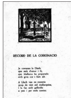
"Record de la coronació", del qual parla la carta 54