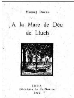
Portada del llibret sobre Lluc

Aquesta tercera part, la constitueixen vuit cartes de la 54 a la 63. A partir de la carta 54 comencen una empresa que durarà una sèrie d'anys i que constitueix la temàtica de les cartes 54-57. És l'edició d'un petit volum de tema religiós que fa referència a Lluç