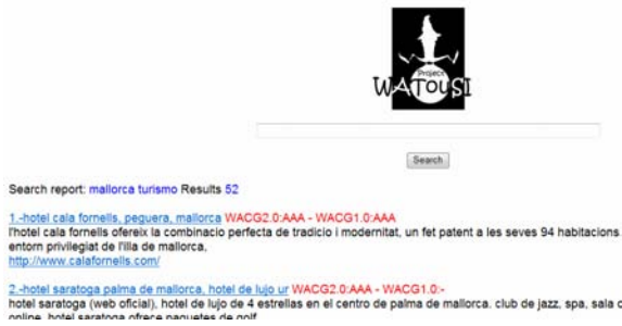
Fig 14. Plana web de resultats que dona el WATouSI Project

Una vegada que s'han introduït les paraules clau es pot fer clic a Search per poder veure els resultats