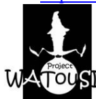
Fig 8. Logotipus del WATouSI Project

El projecte s'anomena WATouSI Project i el cercador de planes web està disponible a http://www.ehib.es/watousi