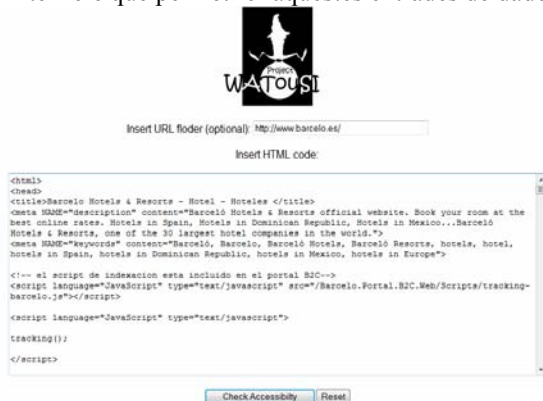
Fig 9. WATouSI Project: entrada de codi per iniciar la correcció dels Punts de Control

La interfície que permet fer aquestes entrades de dades és: