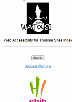
Fig 13. Plana principal del cercador de planes web del WATouSI Project

Amb la base de dades s'ha decidit fer un cercador de planes web confeccionant la llista de resultats ordenada segons els nivells d'accessibilitat, donant prioritat als nivells d'accessibilitat que corresponen a la norma de la WCAG 2.0.