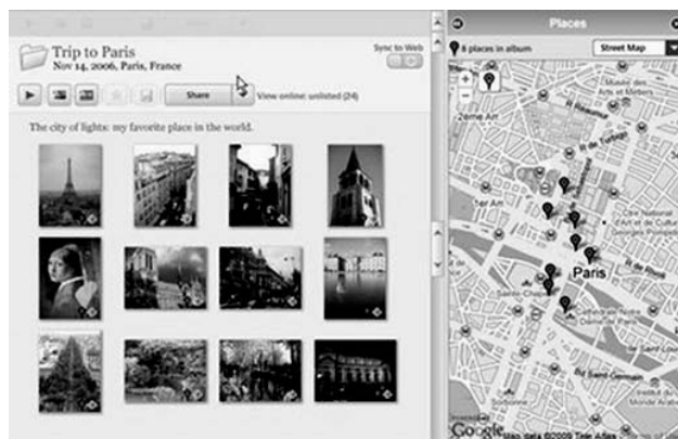
Figura 3. Exemple d'un servei «Geotagget Content Making» de Google Maps

Un exemple és la xarxa social Foursquare que ja compta amb molts d'usuaris registrats a Amèrica.