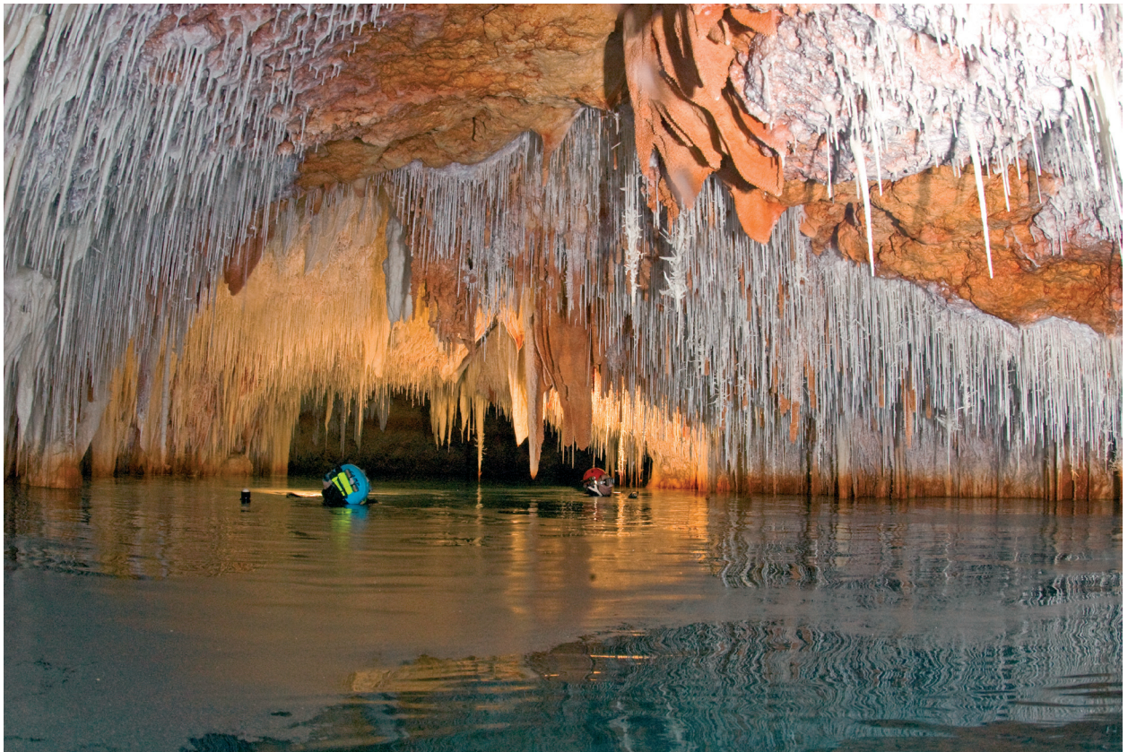
Figura 5: Llac de la sala dels Caramells (Sistema Pirata-Pont-Piqueta, Mallorca).