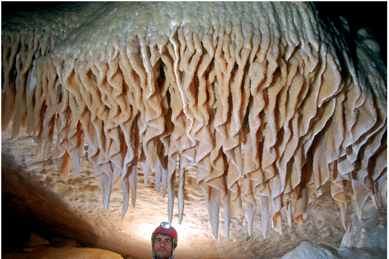
Figura 6: Cova des Pas de Vallgornera (Mallorca).