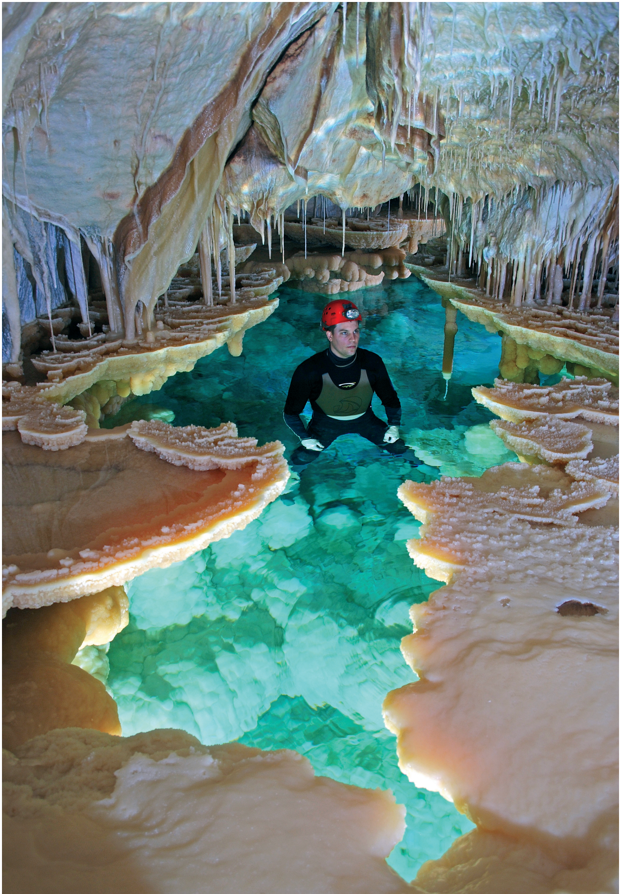
Figura 4: Cova des Pas de Vallgornera (Mallorca).