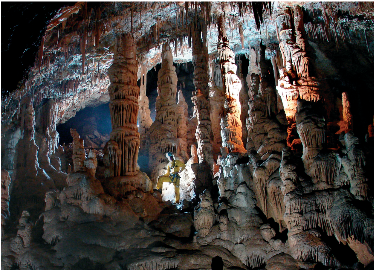
Figura 7: Avenc d'en Corbera (Mallorca).