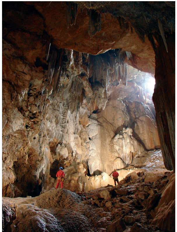
Figura 2: Sala des Llum (cova de sa Campana, Mallorca).

La declaració d'una figura de protecció d'un espai natural derivades de la Llei de Biodiversitat o de la LECO, suposen una protecció dels sistemes càrstics a on es desenvolupa el seu Pla d'Ordenació de Recursos Naturals (PORN). Exemple d'això es pot trobar amb l'aprovació del PORN de la Serra de Tramunata (BOIB 54 ext., 11-04-2007). Aquest decret ja posa de relleu que l'assoliment d'un nivell de protecció adequat dels sistemes hipogeus (coves, avencs i altres cavitats càrstiques) que es localitzen a la Serra és un dels seus objectius i ha de constituir una de les actuacions prioritàries del Pla rector d'ús i gestió (PRUG). El mateix PORN indica expressament que a les coves, avencs i altres cavitats càrstiques queda prohibit l'abocament i/o vessament o disposició de qualsevol classe de residus. Queda prohibida igualment la destrucció, alteració i extracció de qualsevol element geomorfològic de les cavitats subterrànies.