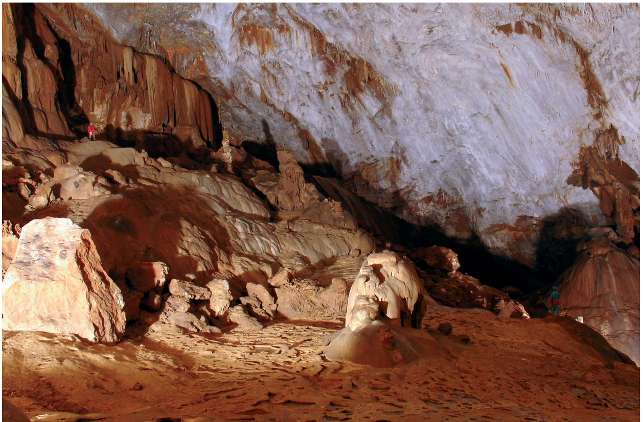
Figura 3: Sala des Gegants (cova de sa Campana, Mallorca).