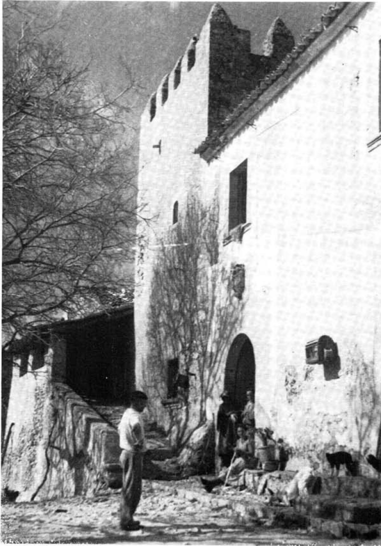
Son Morey d'Artà. Solar de la familia materna del P. Jeroni Nadal.