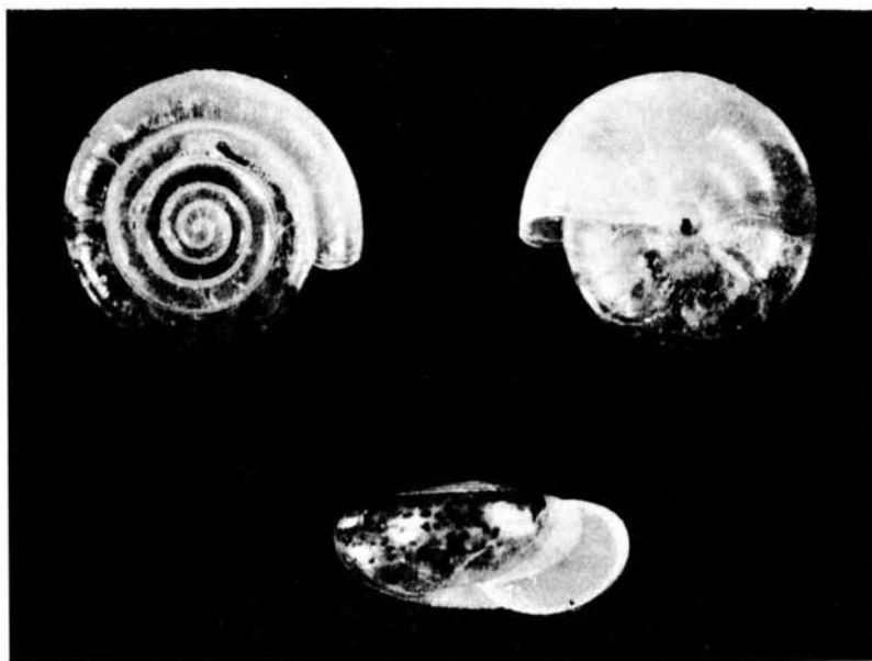
Vitrea gasulli Riedel & Paul. Holotipo. Santa Eulalia. Acequia Hotel Fenicia ca. x 2'5.

Descripción: Concha, para una Vitrea , mediana, de 3 a 3'7 mm. de diámetro, excepcionalmente hasta casi 4 mm., por encima casi plana, con la espira apenas levantada; ombligo estrecho, perforado. Los 4\frac{3}{4} hasta 5\frac{1}{2} de vueltas de espira, planas, de crecimiento muy lento y regular, la última vuelta casi 1\frac{1}{2} veces más ancha que la penúltima. Sutura plana, y las vueltas débilmente hinchadas. La última vuelta en la periferie y por encima fuertemente comprimida, de perfil comprimido-redondeada casi obtusa (especialmente en ejemplares jóvenes); el ángulo o quilla situado en la mitad superior de la vuelta, siendo la concha por debajo más hinchada. Región del ombligo algo hundida. El ombligo, a menudo, algo estrechado por el labio, junto a la columnilla, la pared interior de la última vuelta aquillada en el ombligo; en conchas recientes, a menudo pegadas con barro, tienen entonces la apariencia de no estar umbilicadas. Boca estrecha, cortante, en forma de rendija, lado superior del labio, corto, y el lado basal largo, que en arco suave sobrepasa el lado de la columnilla.