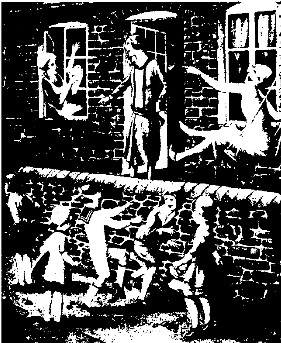
Il·lustració de Roberto Innocenti per a La Ventafocs, de Ch. Perrault