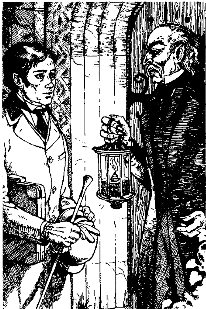
Dràcula a Jonathan Harker: «Benvingut a casa meua! Entri lliurement per la seva pròpia voluntat!» (Il·lustració d'una de les incontables versions de la novel·la).