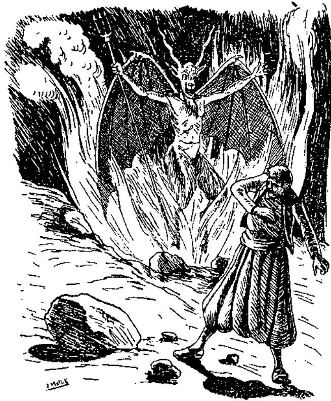
El diable i el vampir, en els contes i les llegendes, apareixen sovint associats a la conflictivitat edíptica (Il·lustració corresponent al conte N'Espirafocs: Rondalles Mallorquines Tom XIII )