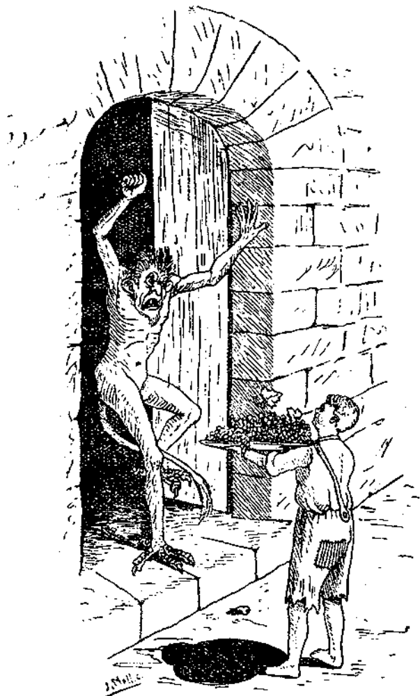
El qui arriba a les mansions del dimoni ha d'evitar passar el portal o que el passi la seva ombra. Altrament, pot estar fet d'ell (Il·lustració del conte Na Blancaflor : Rondalles Mallorquines, Tom XIII)

la novel·la de Bram Stoker i a les seves múltiples versions cinematogràfiques, Joan Prat analitza el tema literariocinematogràfic del comte vampir en la mateixa direcció de la interpretació clàssica psicoanalítica i amb referència expressa als contes de fades: «el tema del parricidi —escriu— el trobam també dins la mitologia popular. Tan sols per citar la més coneguda: un drac (representació deformada de la figura del pare, segons la psicoanàlisi) rapta o devora (manté relacions eròtiques) amb les donzelles (figures sororals i maternals); és vençut i mort (expressió de la rivalitat paternofilial) per un jove heroi (el fill que aspira a ocupar l'estatus del pare) el qual, endemés, es casa amb la donzella (consumació dels desitjos incestuosos)». 22 «La mort de Dràcula —afegeix Prat—, en la qual participen activament tots els seus perseguïdors, pot interpretar-se igualment, seguint els postulats de Freud, com la mort del pare a mans dels seus propis fills». 23