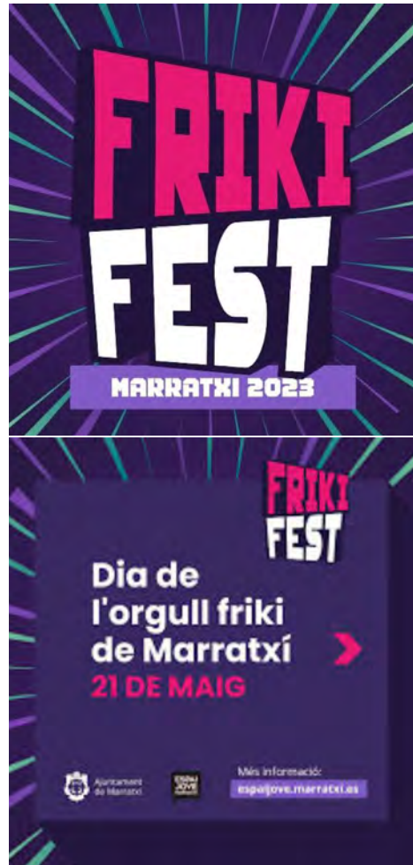
Imatge 4. Cartells promocionals de la segona edició de la Frikifest (2023). Imatge creada pel Departament de Comunicació de l'Ajuntament de Marratxí

La participació en la Frikifest va ser molt elevada i va superar l'assistència de l'edició anterior. A les dues edicions es van omplir les places disponibles per als diferents tallers, i els tallers d'accés lliure van comptar amb joves participants al llarg de tot l'esdeveniment. La bona acollida evidencia que aquest tipus d'iniciatives interessen la població jove i responen a una necessitat de la joventut de trobar-se i compartir interessos i aficions.