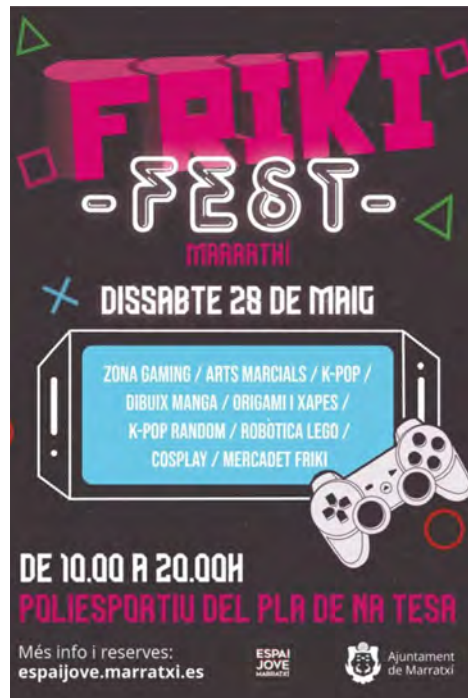
Imatge 3. Cartell promocional de la primera edició de la Frikifest. 2022. Imatge creada pel Departament de Comunicació de l'Ajuntament de Marratxí

L'acollida de la jornada va ser molt bona, amb una participació d'aproximadament 2.000 persones. Els assistents ens traslladaren la seva gratitud per haver format part de l'activitat i la necessitat de fer una segona edició de la Frikifest.