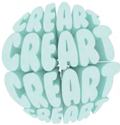
Imatge 2. Logotip i mapa de les distribució de les zones de la segona edició de la Mostra d'Art Jove Crear't. Imatge creada pel Departament de Comunicació de l'Ajuntament de Marratxí