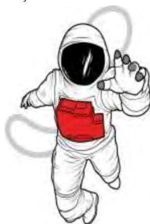
Imatge 1. Imatge logotip dels Espai Joves de Marratxí. Imatge creada pel Departament de Comunicació de l'Ajuntament de Marratxí