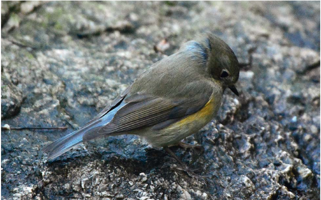
Foto 1. Coablava Tarsiger cyanurus , abeurador de la Comuna de Bunyola. 18 de novembre de 2017.

Photo 1. Red-flanked bluetail Tarsiger cyanurus observed at the pond in Comuna de Bunyola. 18th of November 2017.