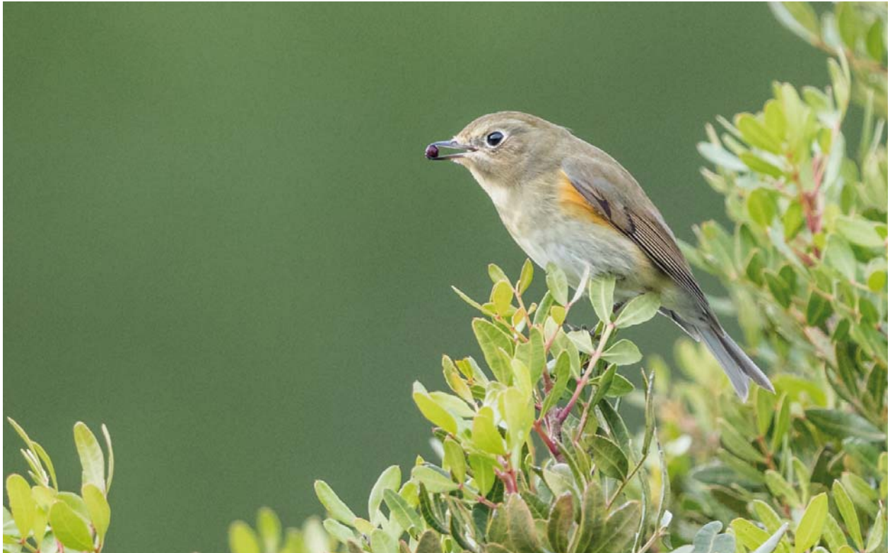
Foto 2. Coablava Tarsiger cyanurus , alimentant-se de fruits de la mata Pistacia lentiscus a la Gola, 6 de novembre de 2018. Photo 2. Red-flanked bluetail Tarsiger cyanurus observed at la Gola feeding on Mastic Pistacia lentiscus berries, 6th of November 2018.

preocupació menor i la seva població es considera estable (UICN, 2016). Mesura uns 13-14 cm de longitud i pesa entre 10 i 18 grams. És una au amb posat de ropit, els mascles de la qual presenten una coloració blava molt vistosa a les parts superiors, parts inferiors clares amb una taca ataronjada als costats, gola blanca i amb una tènue i curta llista superciliar. En el plomatge de les femelles o individus de primer hivern destaca la taca ataronjada del costat i la coablava enfront a la resta del plomatge que esdevé marró a les parts superiors i blanc brut a les inferiors (DEL HOYO et al. , 2005).