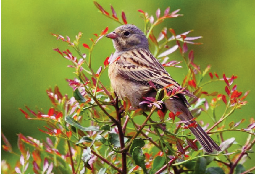
Foto 13. Hortolà cendrós Emberiza caesia (Cretzschmar's Bunting), probablement de segon any calendari, Cabrera, 1 de maig de 2011.

Llabrès) i 2 de maig de 2011 (Eduardo Amengual).