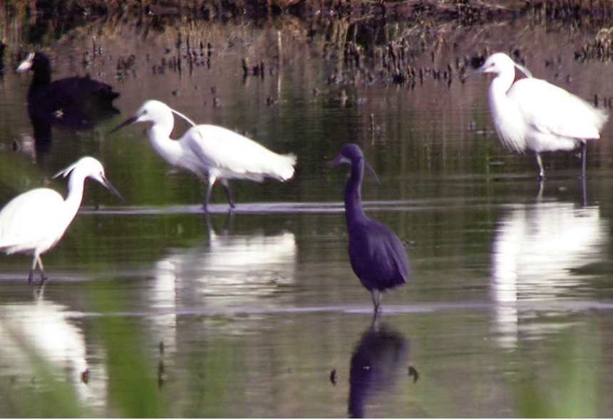
Foto 2. Agró d'escull Egretta gularis gularis (Western Reef Heron), adult, s'Albufera de Mallorca, 28 d'abril de 2011.

entre les subespècies E. g. gularis i E. g. schistacea .