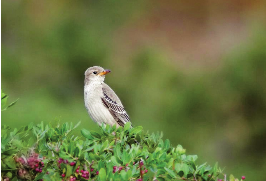
Foto 12. Estornell rosat Pastor roseus (Rose-coloured Starling), primer any calendari, Cabrera, 20 d'octubre de 2011.