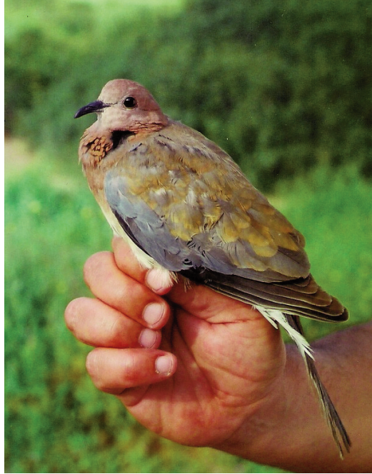
Foto 6. Tórtera del Senegal Streptopelia senegalensis (Laughing Dove), Parc Nacional de Cabrera, 13 d'abril de 2011.