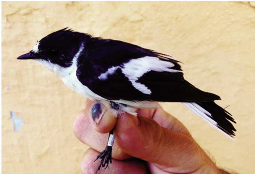
Foto 10. Menjamosques de mig collar Ficedula semitorquata (Semi-collared Flycatcher), mascle adult, Cabrera, 17 d'abril de 2011.