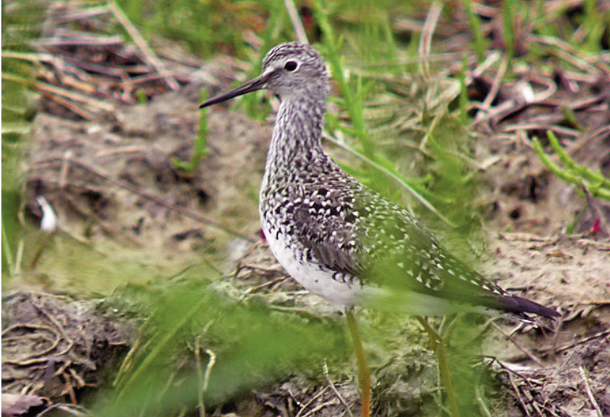
Foto 5. Camagroga Tringa flavipes (Lesser Yellowlegs), s'Albufera de Mallorca, 26 d'abril de 2011.

escàs amb 4 registres (3/IV, 1/V), primera observació l'11 d'abril i darrera el 10 de maig; presència estival, el 25 i 27 de juny i 2 de juliol; pas postnupcial amb 12 cites (3/VIII, 7/IX, 2/X), primer el 6 d'agost i darrer el 26 d'octubre.