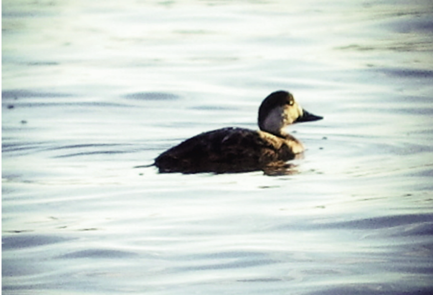
Foto 1. Negreta Melanitta nigra (Common Scoter), femella, Portocolom (Felanitx), 21 de gener de 2013.

Mallorca : s'Albufera, un exemplar el 20 de setembre de 2013, hi ha foto (Maties Rebassa).