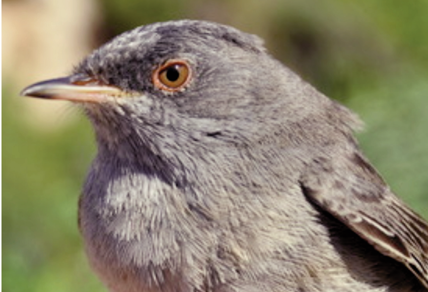
Foto 8. Busqueret sard Sylvia sarda (Marmora's Warbler), mascle de segon any calendari, illa de l'Aire (Sant Lluís, Menorca), 17 d'abril de 2011.

amb 32 registres (14/IV, 17/V, 1/VI), primer el 6 d'abril i darrer el 3 de juny; pas postnupcial, tan sols tres cites, el 5, 22 i 25 de setembre.