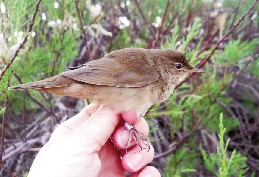
Foto 7. Boscaler Locustella luscinioides (Savi's Warbler), adult, illa de l'Aire (Sant Lluís, Menorca), 5 d'abril de 2013.