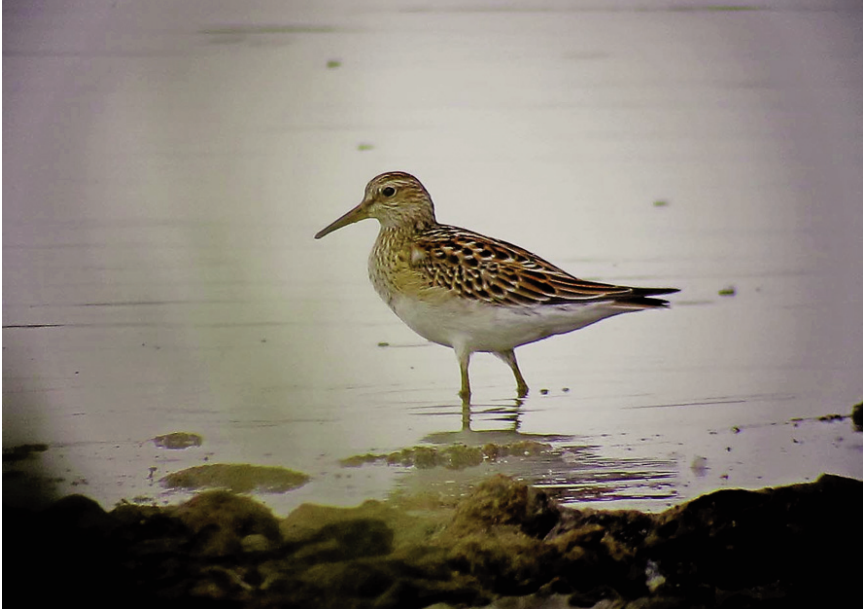
Foto 4. Corriol pectoral Calidris melanotos (Pectoral Sandpiper), au de primer any, Salobrar de Campos, 22 de setembre de 2011.

ha un cita al gener. En el pas prenupcial només una, el 4 d'abril; i en el pas postnupcial, 23 registres (6/VIII, 13/IX, 4/X), del 16 d'agost fins al 30 d'octubre.