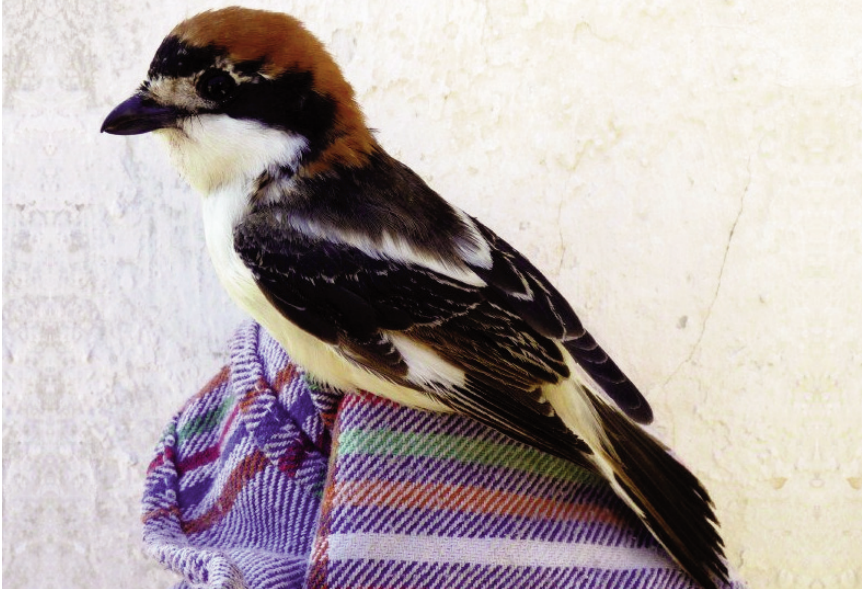
Foto 11. Capsigrany Lanius senator niloticus (Woodchat Shrike), mascle de segon any calendari, Cabrera, 8 de maig de 2011.

comitè considera que aquest exemplar pot procedir de la mateixa zona d'intergradació a Turquia, perquè el blanc a la base de la coa és reduït (18 mm, quan el límit superior és de 15 mm per a senator ). Les aus de molt a l'est tenen les coes molt més blanques (entre 25-30 mm, ROWLANDS, 2010). Les tres cites anteriors es donen entre el 4 i 23 d'abril i són totes també d'illes mediterrànies (Columbrets i illa de l'Aire, Menorca, DE JUANA, 2006), (GUTIÉRREZ, et al. 2013).