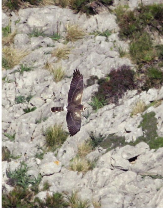
Foto 3. Arpella pàl·lida Circus macrourus (Pallid Harrier), femella de segon any, talaia d'Albercutx (Pollença), 10 d'abril de 2010.

Mallorca : aeroport de Palma, un adult, hi ha fotos, el 25 de novembre de 2011, atropellat a prop de la torre de control (José Luis Martínez).