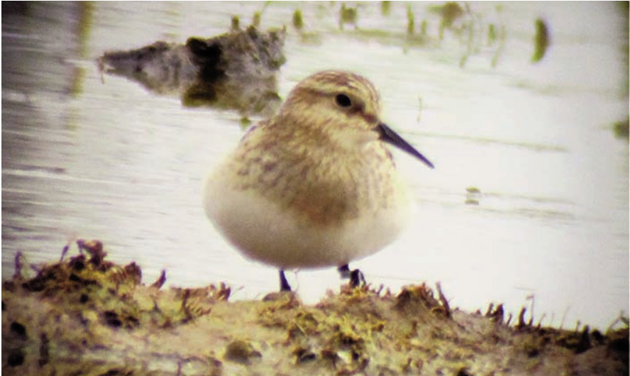
Foto 1. Detalle de la forma achatada del correlimos de Baird Calidris bairdii observado en el Prat de Sant Jordi (Palma, Baleares) el 8 de octubre de 2011.

Photo 1. Detail of the broad-chested appearance of the Baird's Sandpiper Calidris bairdii observed at the Prat de Sant Jordi (Palma, Balears) on 8 th October 2011.