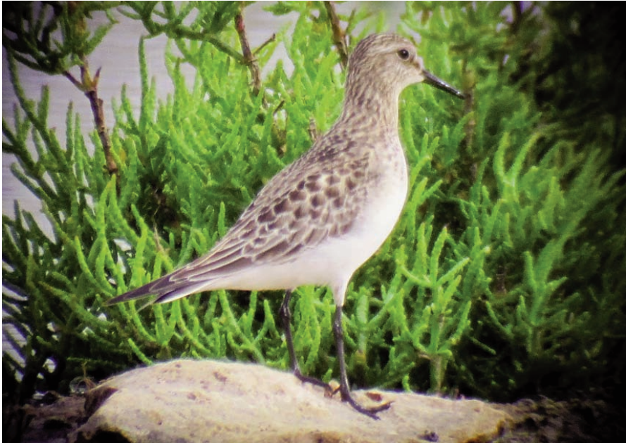
Foto 2. Aspecto general del correlimos de Baird Calidris bairdii observado en el Prat de Sant Jordi (Palma, Baleares) el 8 de octubre de 2011.

Photo 2. General appearance of the Baird's Sandpiper Calidris bairdii observed at the Prat de Sant Jordi (Palma, Baleares) on 8 th October 2011