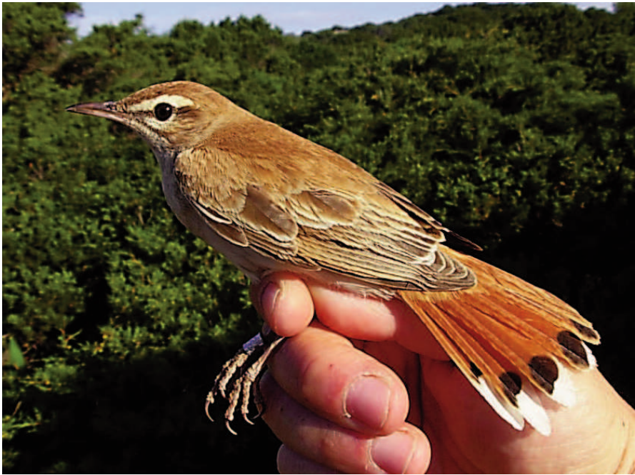
Foto 7. Coadreta Cercotrichas galactotes (Rufous Bush Robin), adult. Sa Conillera (Sant Josep), maig de 2010.

Photo 7. Rufous bush robin Cercotrichas galactotes , adult. Sa Conillera (Sant Josep), May 2010.