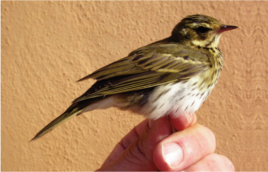
Foto 6. Titina d'esquena olivàcia Anthus hodgsoni (Olive-backed Pipit). Cabrera, octubre de 2008.

Photo 6. Olive-backed pipit Anthus hodgsoni. Cabrera, October 2008.