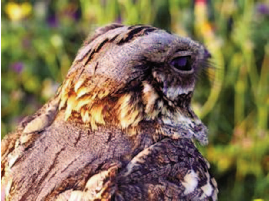
Foto 5. Siboc Caprimulgus ruficollis (Red-necked Nightjar), femella adulta. Can Marroig (Formentera), maig de 2009.

Photo 5. Red-necked nightjar Caprimulgus ruficollis , adult female. Can Marroig (Formentera), May 2009.