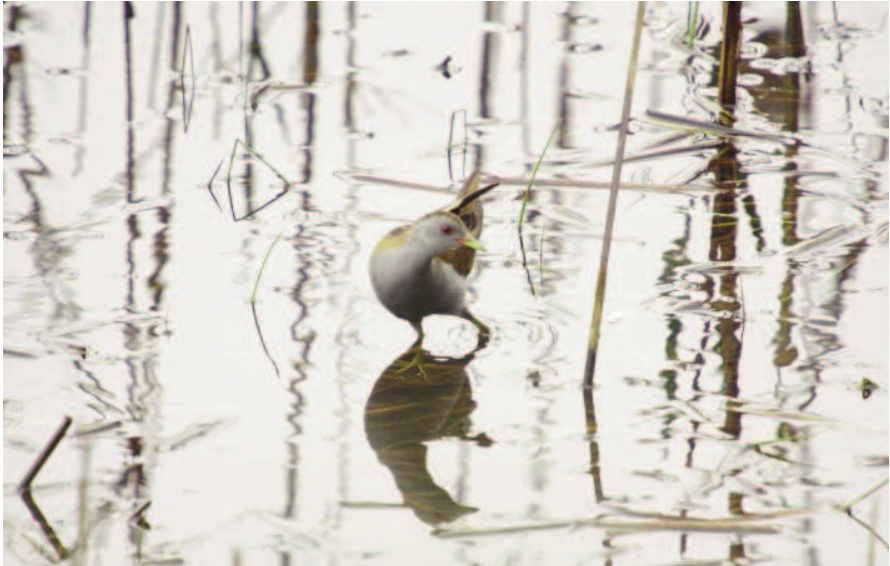
Foto 1. Rascleró Porzana parva (Little Crane), mascle. S'Albufera des Grau (Maó) març de 2010.

Photo 1. Little crane Porzana parva, male. S'Albufera des Grau (Maó), March 2010.