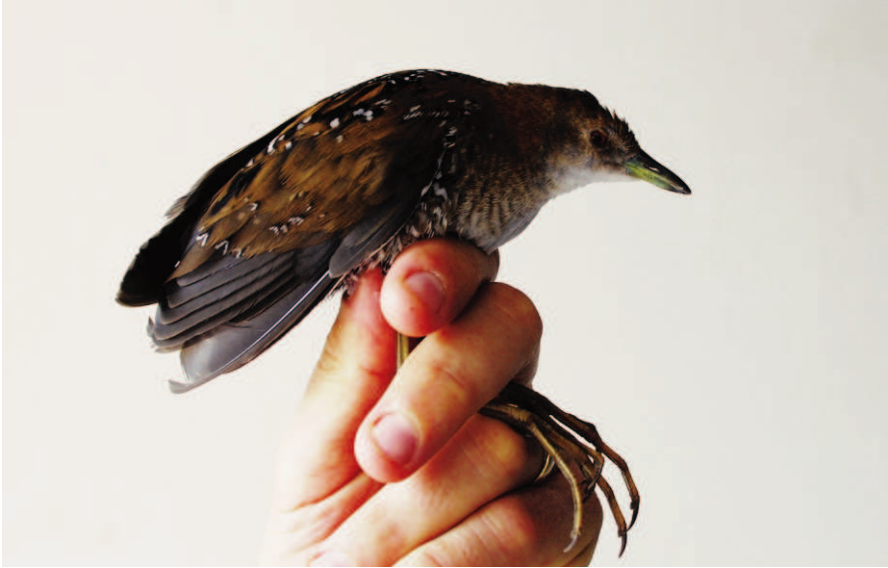
Foto 2. Rascllet gris Porzana pusilla (Baillon's Crake). Casc urbà de Ciutadella, octubre de 2009.

Photo 2. Baillon's crake Porzana pusilla. Centre of Ciutadella, October 2009.