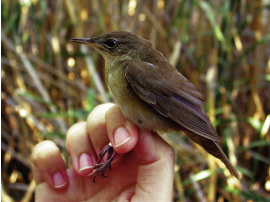
Foto 9. Boscaler Locustella luscinioides (Savi's Warbler), juvenil. Parc Natural de s'Albufera de Mallorca, agost de 2008.

Photo 9. Savi's warbler Locustella luscinioides, juvenile. Parc Natural de s'Albufera de Mallorca, August 2008.