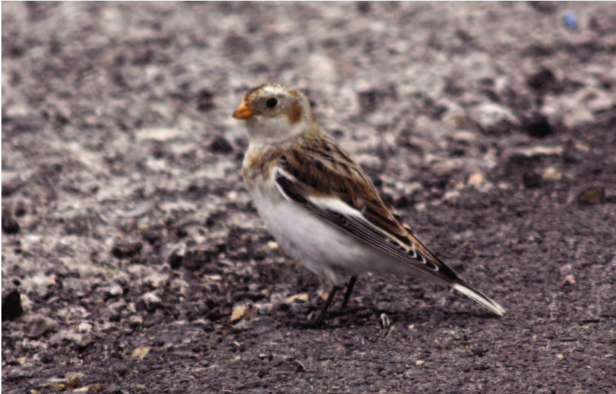
Foto 12. Sit blanc Plectrophenax nivalis (Snow Bunting), mascle. Aeroport de Menorca (Maó), novembre de 2010.

Photo 12. Snow bunting Plectrophenax nivalis, male. Menorca airport (Maó), November 2010.