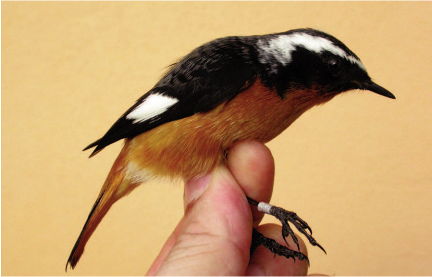
Foto 8. Coa-roja diademada Phoenicurus moussieri (Moussier's Redstart), mascle adult. Cabrera, octubre de 2008.

Photo 8. Moussier's redstart Phoenicurus moussieri, adult male. Cabrera, October 2008.