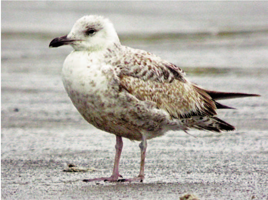
Foto 3. Gavina atlàntica Larus argentatus (Herring Gull), de segon any de calendari. Port de Palma, maig de 2010.

Photo 3. Herring gull Larus argentatus, second-year. Palma port, May 2010.