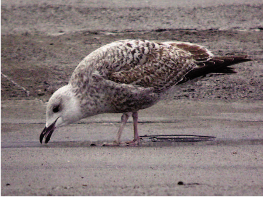
Foto 4. Gavina atlàntica subespècie argentatus (Herring Gull) Larus argentatus argentatus , de quart any de calendari. Al moll Vell del port de Palma, novembre de 2010.