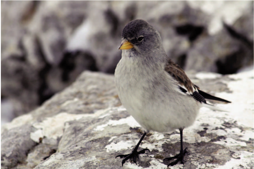
Foto 11. Gorrió d'ala blanca Montifringilla nivalis (Snow Finch). Puig de Massanella (Escorca), gener 2009.

Photo 11. Snow finch Montifringilla nivalis. Puig de Massanella (Escorca), January 2009.