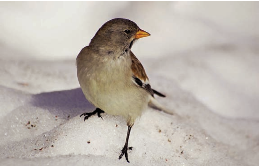
Foto 16. Gorrió d'ala blanca Montifringilla nivalis (Snow Finch). Puig Major (Escorca), desembre de 2008.