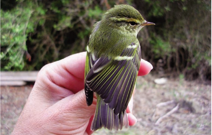
Foto 13. Ull de bou de dues retxes Phylloscopus inornatus (Yellow-browed Warbler). Albufera des Grau (Maó), octubre de 2007.