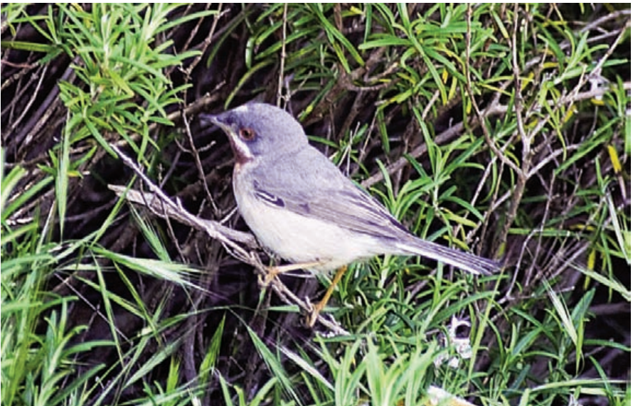
Foto 12. Busqueret garriguer subespècie oriental Sylvia cantillans albistriata (Subalpine Warbler race albistriata ), mascle. Cap de Barbaria (Formentera), abril de 2007.