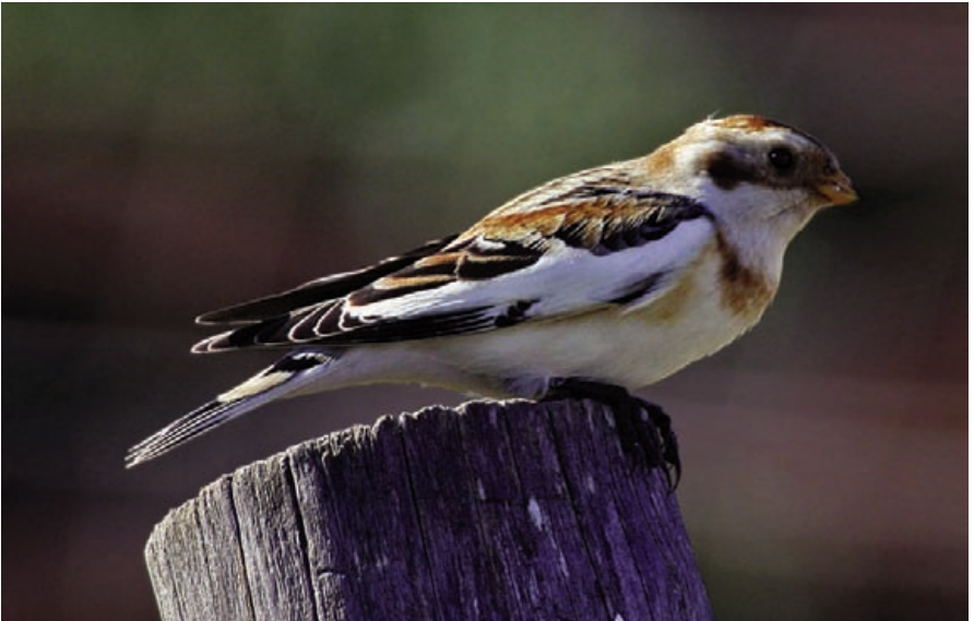
Foto 18. Hortolà blanc Plectrophenax nivalis (Snow Bunting), mascle adult. Ca los Camps, Colònia de Sant Pere (Artà), novembre de 2009.