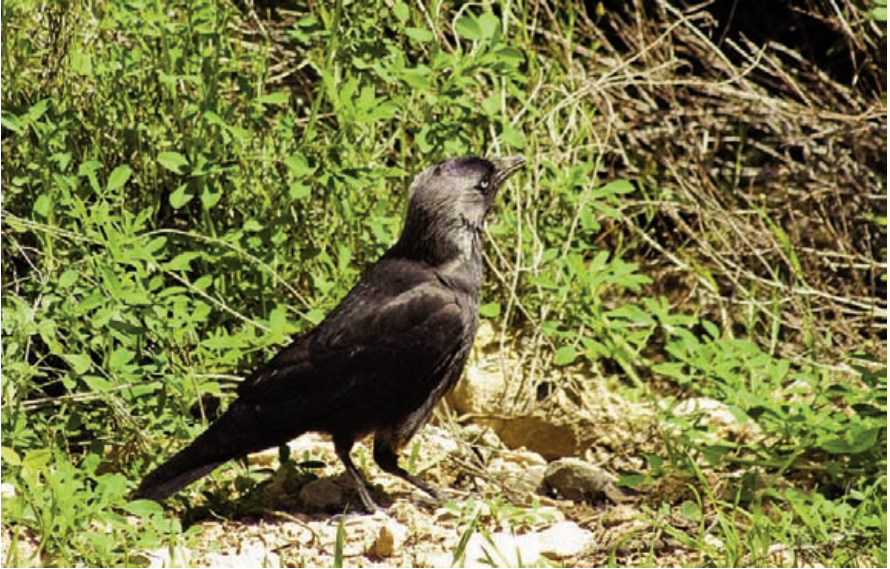
Foto 15. Gralla Corvus monedula (Jackdaw). Illa sa Dragonera, abril de 2009.