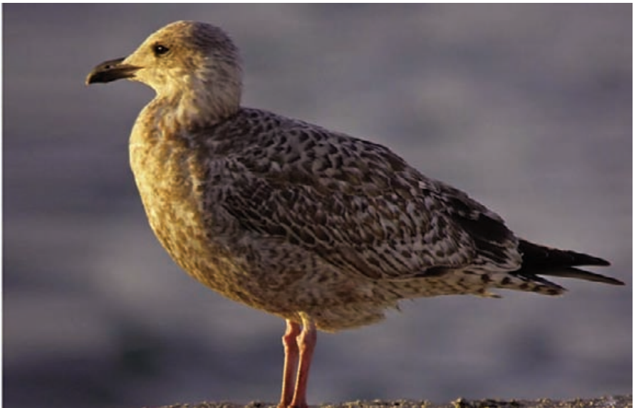
Foto 4. Gavina atlàntica Larus argentatus (Herring Gull), ocell de primer any. Port de Palma, octubre de 2009.