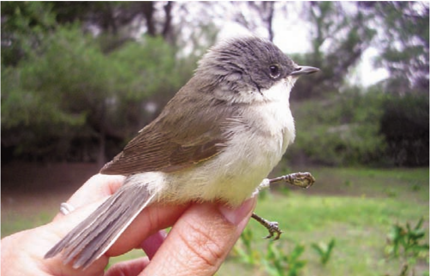
Foto 10. Busqueret xerraire Sylvia curruca (Lesser Whitethroat). Ocell de segon any calendari. Illa d'en Colom (Maó), maig de 2007.