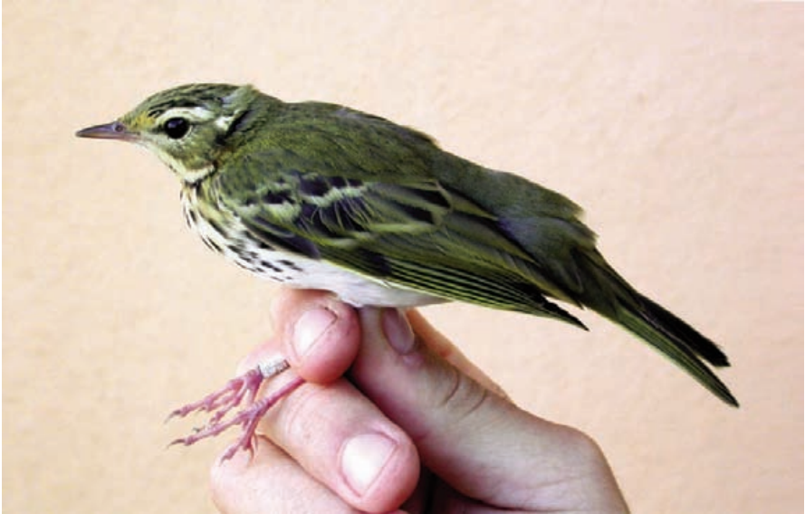
Foto 7. Titina d'esquena olivàcia Anthus hodgsoni (Olive-backed Pipit), mostra trets de la subespècie yunnanensis . Cabrera, octubre de 2007.