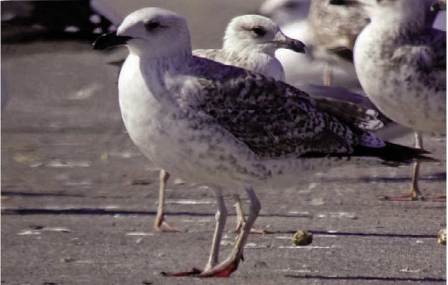
Foto 5. Gavinet Larus marinus (Great Black-backed Gull), au de segon any calendari. Port de Palma, abril de 2009.