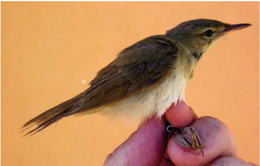
Foto 8. Boscarla de Blyth Acrocephalus dumetorum (Blyth's Reed Warbler), immadura de primer hivern. Cabrera, octubre de 2007.