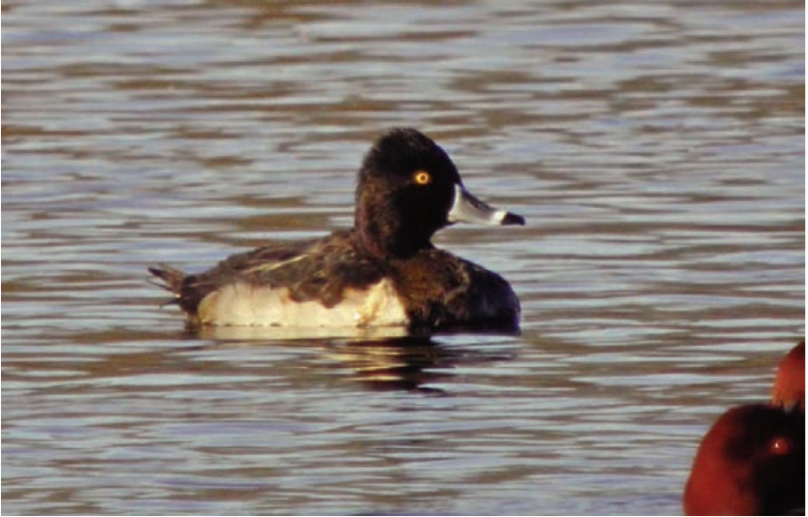
Foto 1. Moretó de collar Aythya collaris (Ring-necked Duck), mascle de primer hivern. S'Albufera de Mallorca, desembre de 2007.