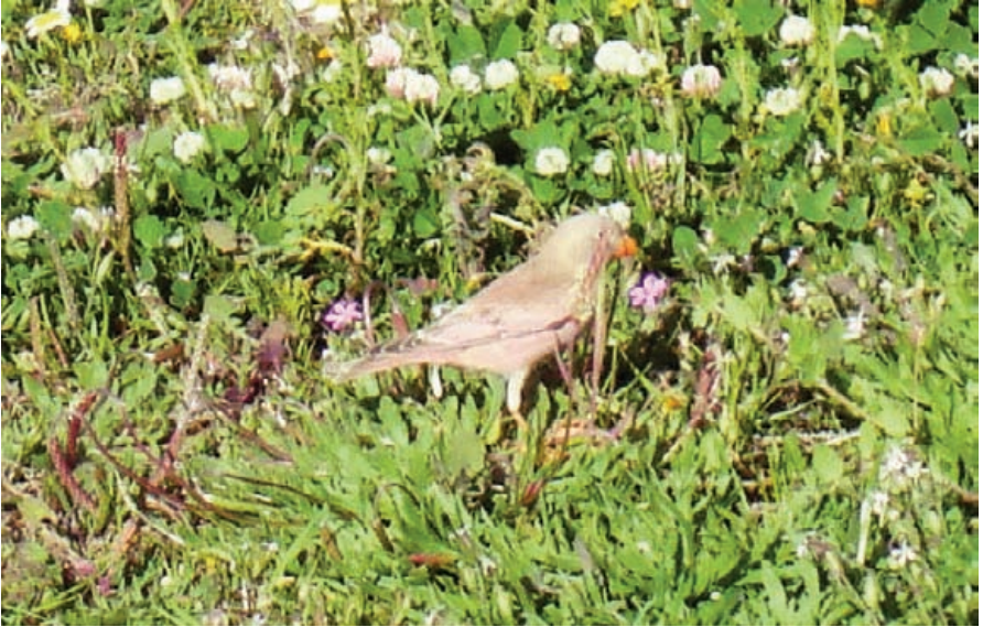
Foto 17. Pinsà trompeter Bucanetes githagineus (Trumpeter Finch). Albufera des Grau (Maó), març de 2008.