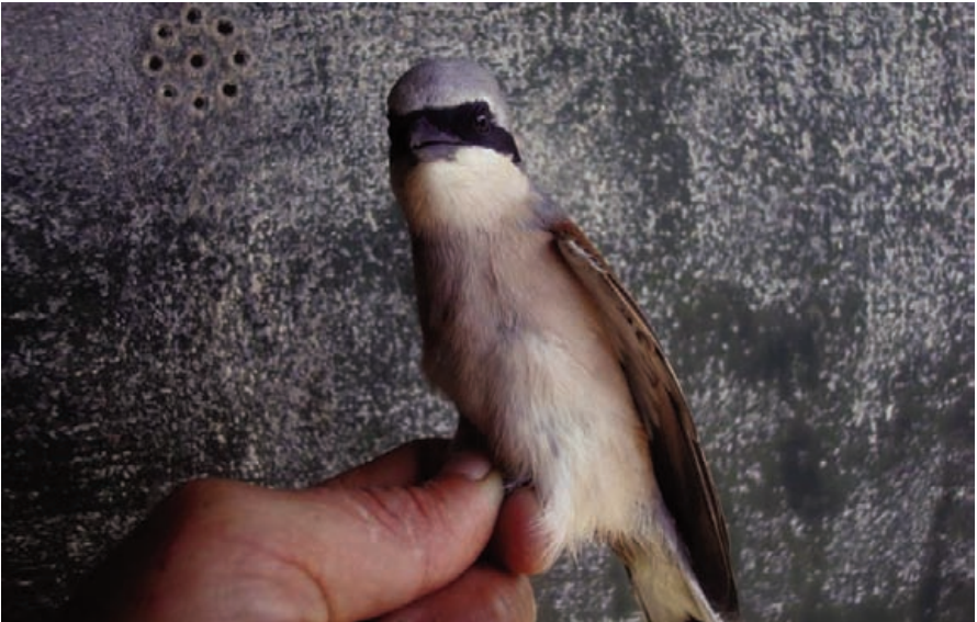
Foto 14. Capsigrany roig Lanius collurio (Red-backed Shrike), mascle. Illa de l'Aire (Sant Lluís), maig de 2009.