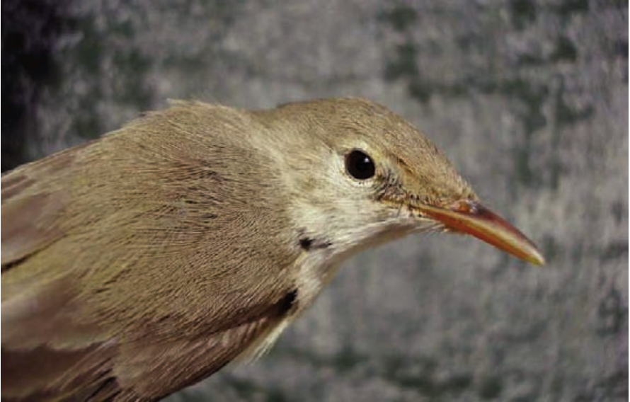
Foto 9. Bosqueta pàl·lida Hippolais opaca (Isabelline Warbler), almenys de segon any. Illa de l'Aire (Sant Lluís), abril de 2008.