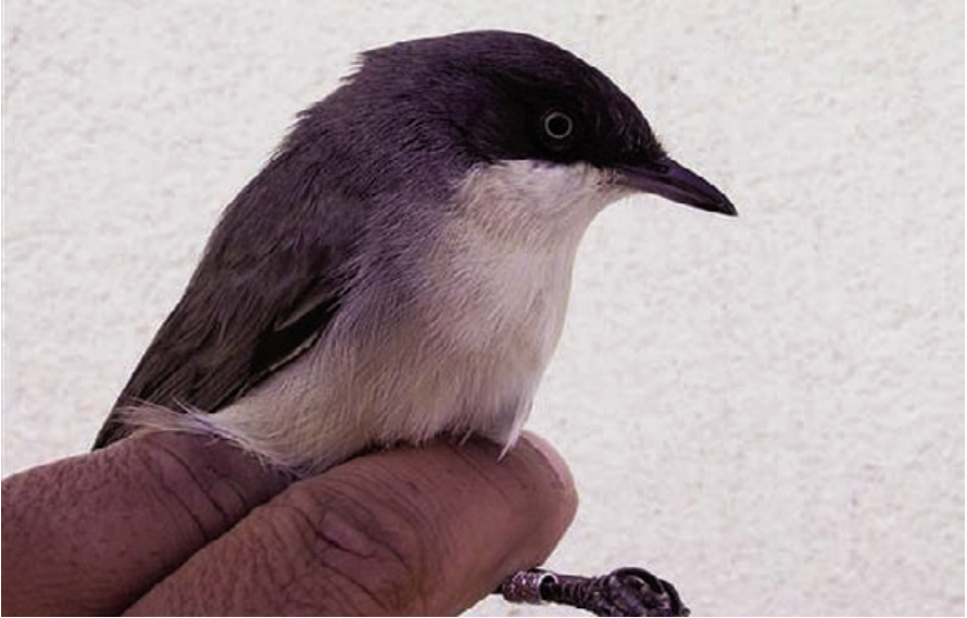
Foto 11. Busqueret emmascarat Sylvia hortensis (Orphean Warbler), mascle. Illa de l'Aire (Sant Lluís), abril de 2009.