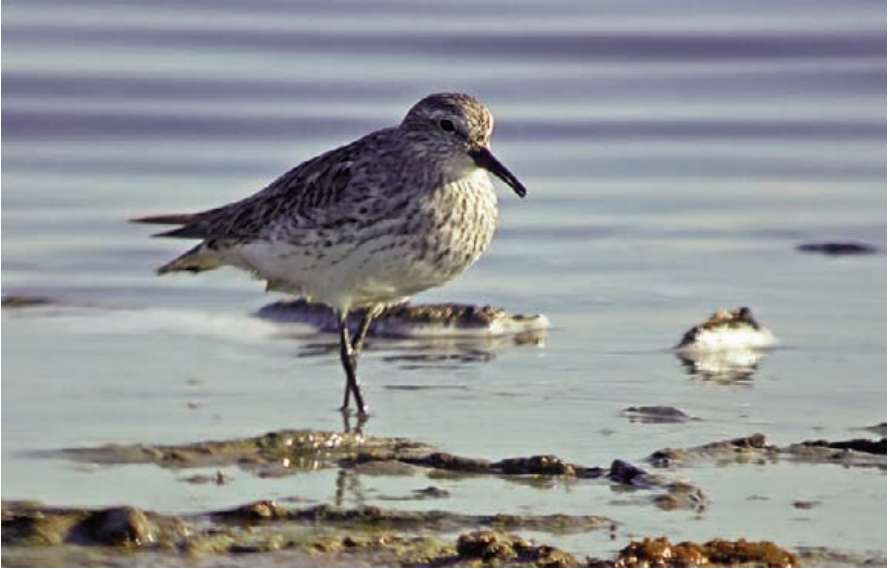
Foto 3. Corriol coablanca Calidris fuscicollis (White-rumped Sandpiper), adult. Salobrar de Campos, agost de 2007.