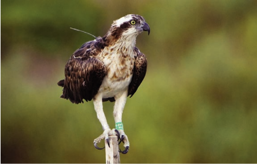
Foto 1. Karin, la femella monitoritzada d'àguila peixatera Pandion haliaetus , fotografiada al Parc Natural de s'Albufera l'agost de 2009, després del seu retorn postnupcial a Mallorca.

Photo 1. 'Karin', the monitored female Osprey Pandion haliaetus, photographed in the Albufera Natural Park in August 2009, after her postnuptial return to Mallorca.