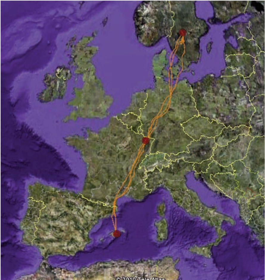
Figura 1. Rutes migratòries seguides en els tres viatges per la femella d'àngula peixatera "Karin" Pandion haliaetus . S'indiquen la zona d'hivernada a Mallorca, la zona d'aturada migratòria al nord-est de França i la zona de reproducció a Suècia.