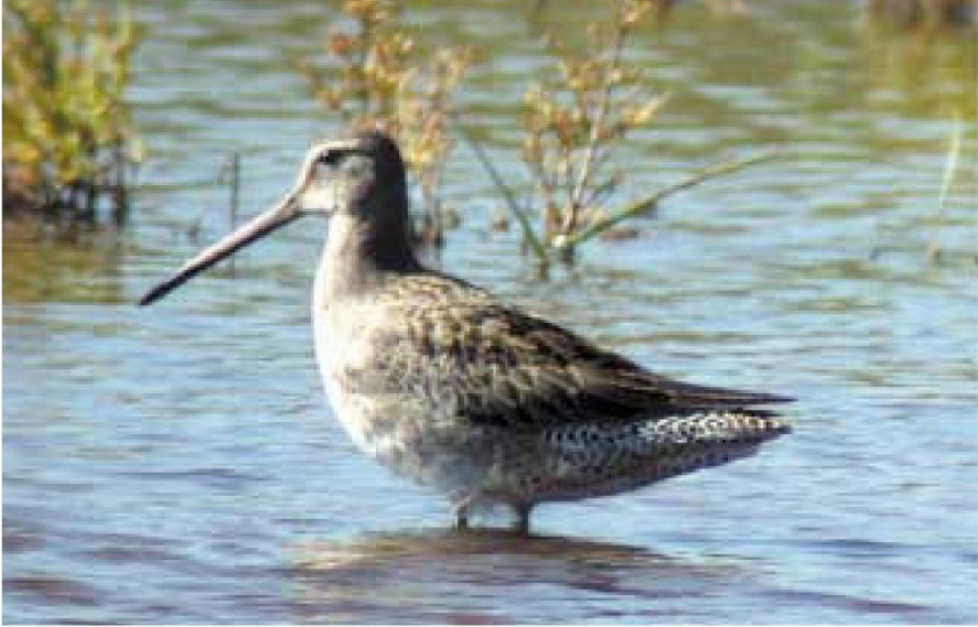
Foto 1. Long-billed Dowitcher, Limnodromus scolopaceus , seen in the Parc Natural de s'Albufera de Mallorca, October 2002.