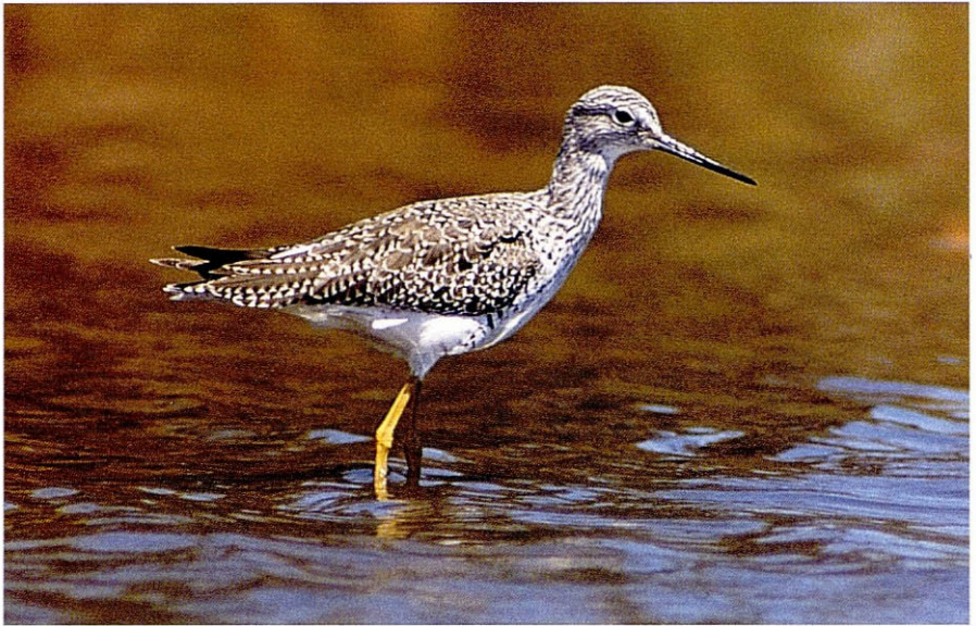
Foto 1. Camagroga gros Tringa melanoleuca , (Greater Yellowlegs), Salobrar de Campos (Mallorca), maig 1995.

per a les Balears sinó per a tot el Mediterrani.