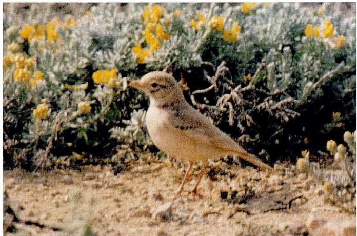
Fotos 1, 2 i 3. Terrolot cuabarrat Ammomanes cincturus , (Bar-tailed Desert Lark), Cap de ses Salines (Mallorca), març 1994.