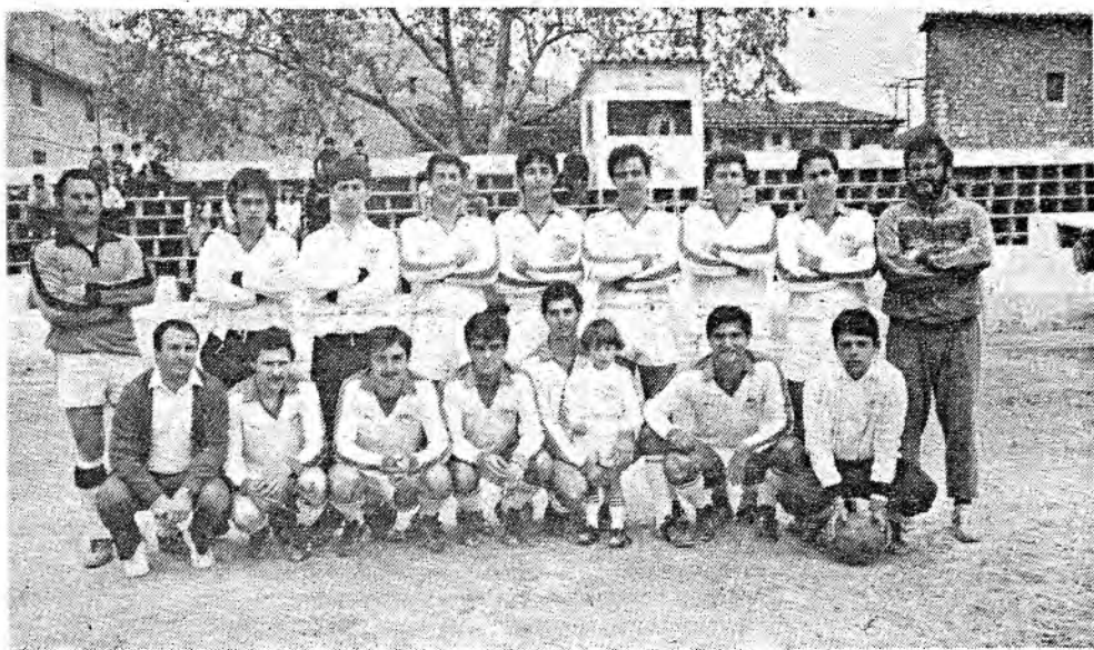
EQUIP DEL SPORTING QUE HA PUJAT A LA FI, A SEGONA REGIONAL.