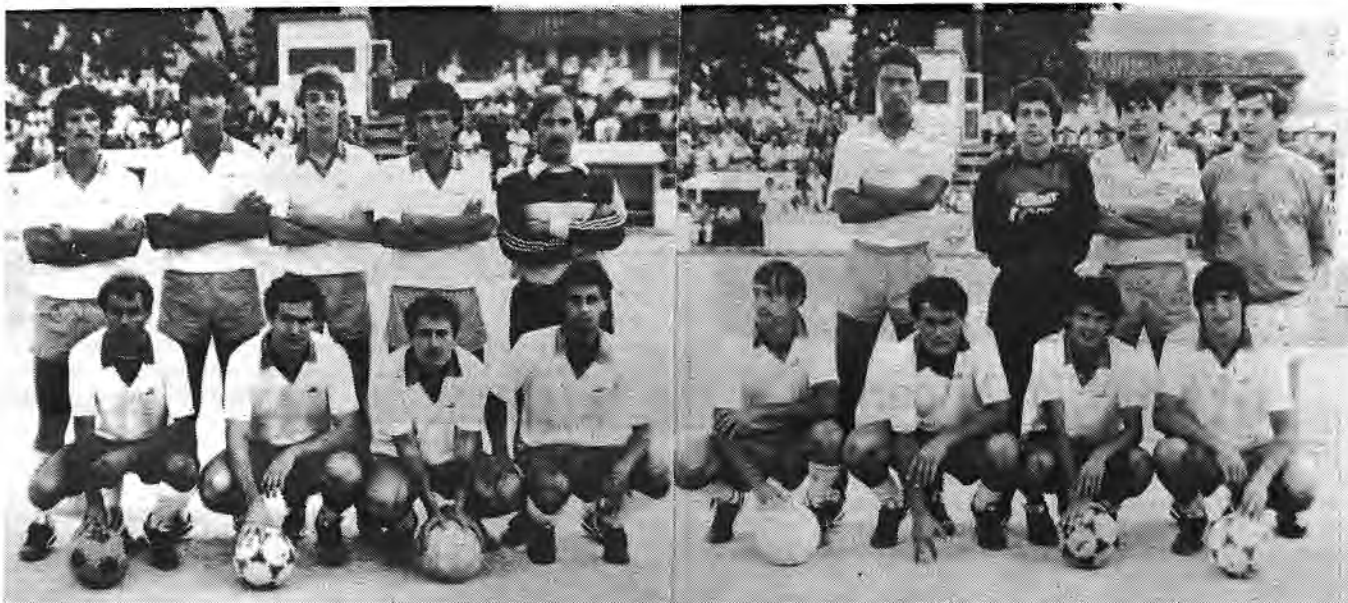
L'afició, en gran nombre, va tenir ocasió dilluns de conèixer i aplaudir als integrants del Sóller 85-86. Per una part tenim als jugadors que segueixen i a l'altre, a les noves incorporacions. Tots ells seran presents demà davant el R. Mallorca de B. Joanet.

Com a símptoma clar de l'expectació que hi ha