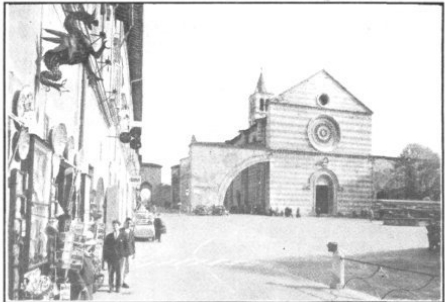
Basilica de Santa Clara en Asís

ñor con el que Clara se ha desposado. Ojos y corazón en Cristo han de ponerse. Para ver su vida e imitar su virtud. Para identificarse con sus sentimientos y hacer de la propia existencia una prolongación de la misma presencia de Cristo en el mundo. Misteriosa transformación interior por la gracia que conduce a