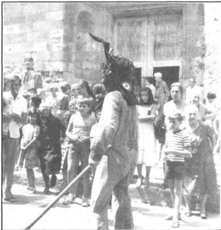
El Dimoni Pep Mut a la festa dels Àngels

Per això és que parlar en aquests moments és per a mi deliciós. Hauríem d'organitzar homenatges a auguers, pastors, margers, etsequelladors, empeltadors, bellerols, etc.