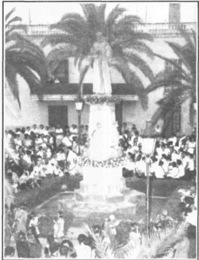
Plaza del Beato Junípero Serra en Petra

Tras la extinción de la Compañía de Jesús, los padres jesuitas abandonan las misiones que tenían en la Baja California. A nuestro Beato