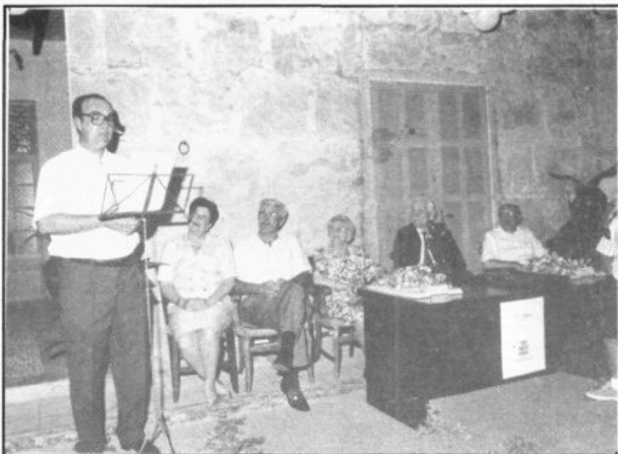
Un moment de l'homenatge a "Pep el Mut"

Després dels esforços de la teva mare per ensenyar-te a expressar guturalment qualche paraula, que ho feia posant-te un objecte davant la teva mirada i fent-te repetir un parell de vegades la paraula corresponent; anares a escola a una casa que hi havia a la plaça del Pare Serra. El mestre era de Sa Pobla i era molt castigador, ja que pegava als