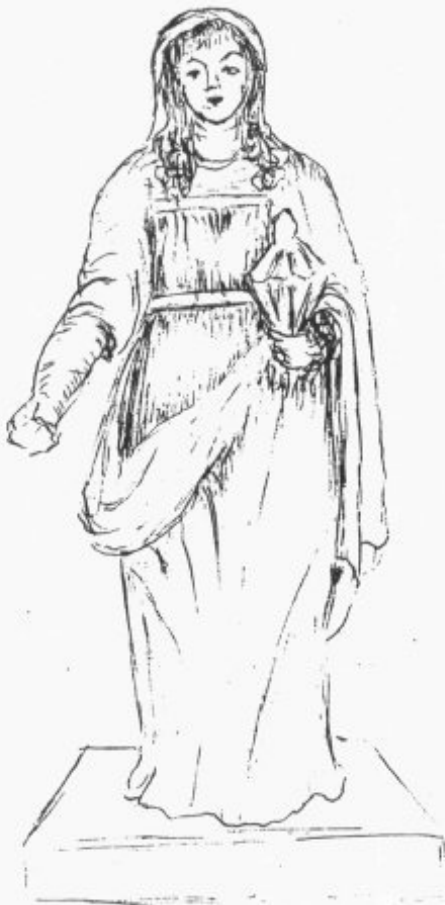
La Patrona Santa Praxedis