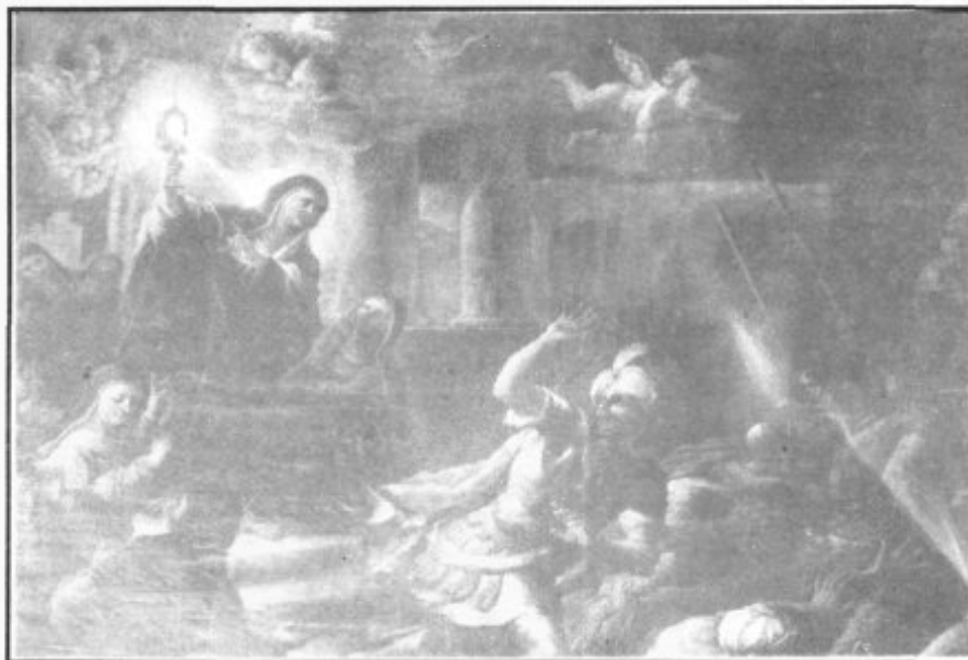
Santa Clara ahuyenta a los sarracenos con el poder de la Custodia.

Jesucristo. Escondida en el corazón de Cristo, allí siente y ama. Desde ese amor ardiente contempla todas las cosas. El costado abierto del Señor crucificado era fuente de amor y puerta por donde el alma debía entrar para sentir la fuerza y la profundidad del amor de Cristo. Clara se santigua con agua bendita. Y quiere que sus hermanas hagan lo mismo. Pues el agua santa es como una señal del agua que salió del costado abierto de Cristo (vida 32:-3218).