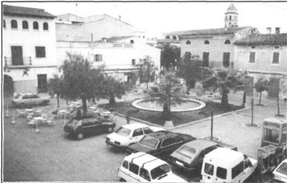
Plaza del Beato Raimundo Lulio en Petra

Raimundo Lulio, aristócrata de cuna, hombre casado y padre de familia, rico en bienes y más rico aún en sabiduría, escritor y gran pensador, gastó todo su haber, su gran patrimonio en la verdadera causa por la que merecía la pena vivir y ofrecer hasta la propia vida. Su espíritu de apóstol le llevó a predicar la fe de Cristo por Siria, Palestina, Egipto, Etiopía y Mauritania. Aprendió el árabe y consiguió del rey D. Jaime II la fundación de un colegio en Miramar para que los franciscanos tuvieran