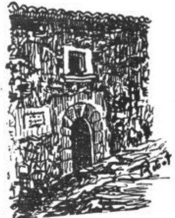
CASA DE FRAY JUNIPERO SERRA