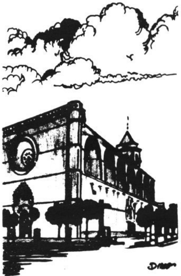
IGLESIA PARROQUIAL DE PETRA