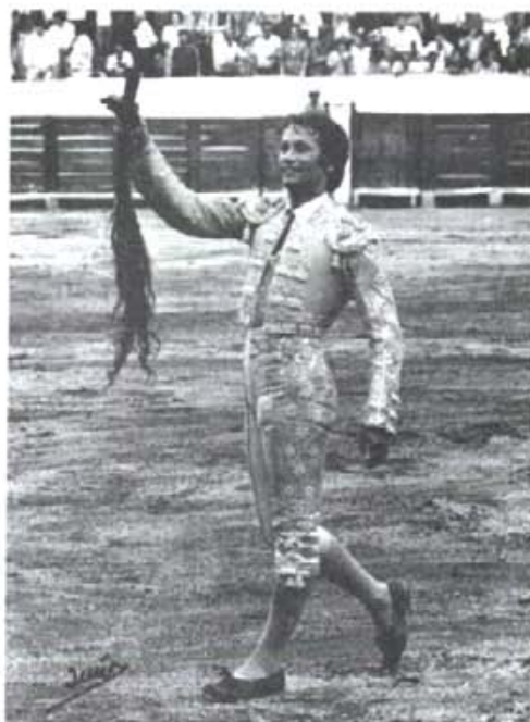
ANTES DE LA CORRIDA SEBASTIAN PALOMO LINARES