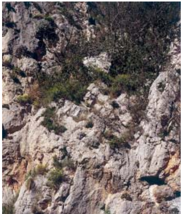
Foto 5: La comunitat rupícola de violeta de penyal (ass. Hippocrepidum balearicae ).