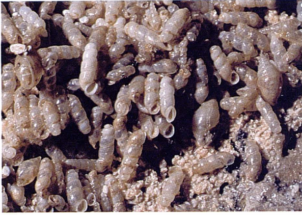
Figura 4: Abundants exemplars de Truncatella subcilindrica que indiquen un nivell d'inundació de la cavitat.