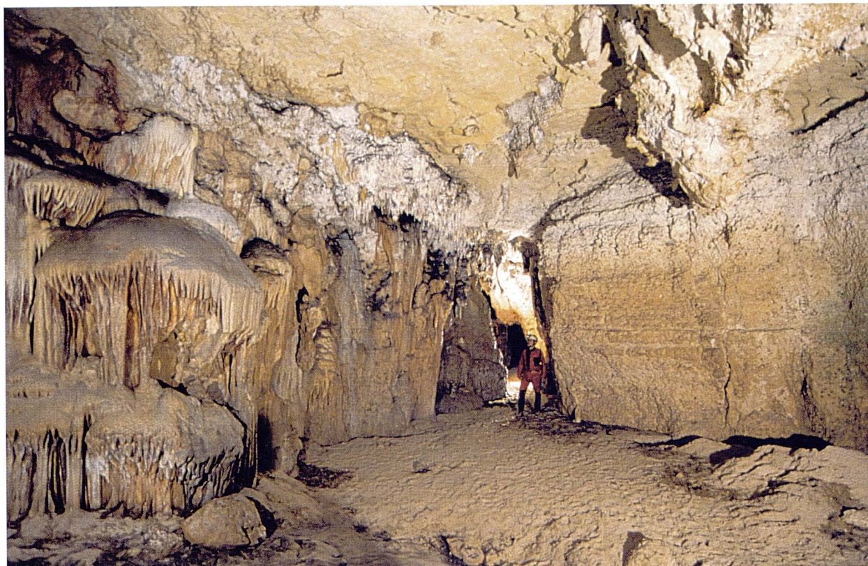
Figura 2: Sala Principal de la cova de ses Pedreres. Es poden observar al terra els sediments litorals recents introduïts dins la cavitat pels efectes dels temporals.