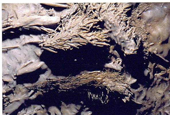
Figura 3: Rizomes de Posidonia oceanica en el procés inicial de concrecionament en comparació amb un rizoma dipositat recentment. Foto R. Landreth.

nades, la qual cosa mai havíem observat a cap altre cavitat. Les restes de Posidonia , especialment rizomes, juntament amb les arenes, han entrat dins la cavitat per l'acció dels temporals i han de romandre el temps suficient per poder començar a concrecionar-se i no ser arrabassades per l'acció d'una nova entrada d'aigua marina (Figura 3). Recentment s'ha observat el mateix fenomen a una cova litoral d'Alcúdia (VICENS i CRESPI, en preparació).