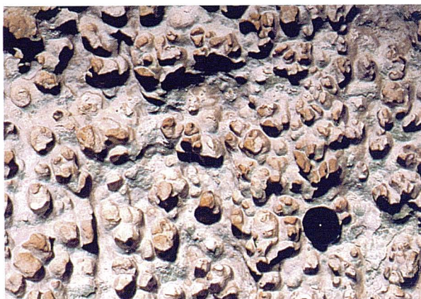
Figura 5: Morfologies de la sala Principal que recorden els nius d'abella. S'han format a la paret on afloren les calcarenites miocenes.

Per acabar, comentar que a la zona O de la sala Principal, les calcàries del Complex Terminal del Miocè superior presenten unes morfologies que recorden els nius d'abella descrits per GOMEZ i FORNÓS (2001) trobats a algunes parts del litoral de Mallorca.