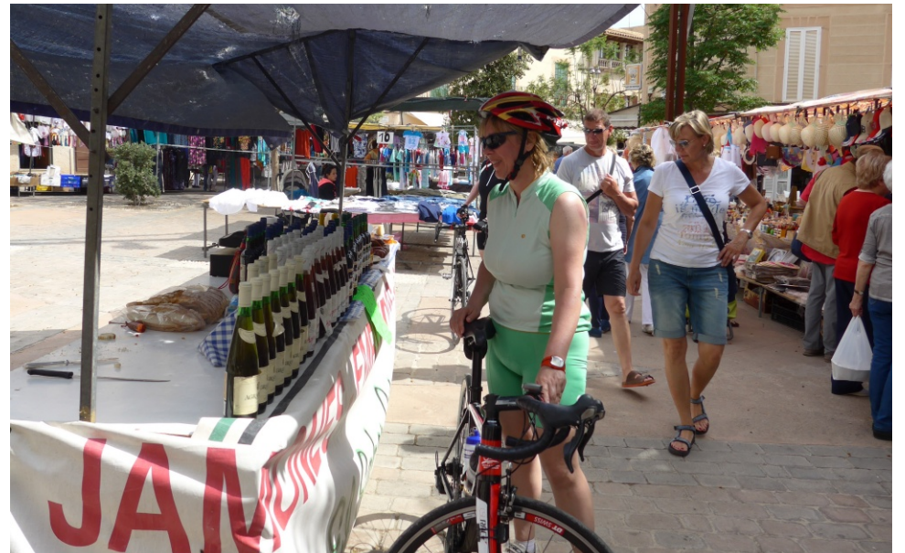
Mercat setmanal d'un poble del Pla, on cada vegada hi ha més parades dirigides al turisme.

També respecte les migracions contemporànies, és important fer èmfasi en la generalització de l'impacte arreu de l'illa que fins a finals dels anys noranta es limitava a la conurbació de Palma i les zones turístiques. Sens dubte, l'espai on més s'ha notat aquest canvi és el que conforma l'interior de l'illa. Un territori on els darrers anys hi ha hagut un augment significatiu de les iniciatives destinades a promoure el turisme d'interior mitjançant la posada en marxa d'agroturismes, però sobretot gràcies a la demanda de mà d'obra per a la construcció i rehabilitació de segones residències. Un procés descrit i definit per Jaume Binimelis com a rurbanització (Binimelis, 2002: 209) pel qual l'interior de l'illa comença a caracteritzar-se per l'existència d'una àrea i una morfologia física, espacial i humana a mig camí