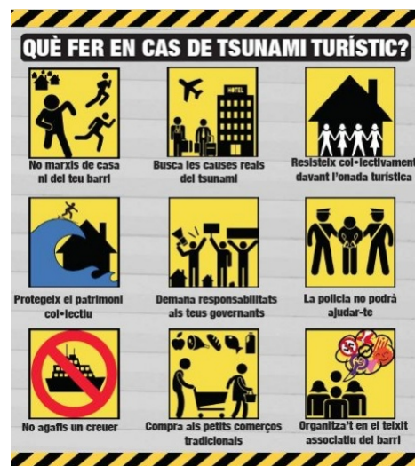
Campanya contra la turistització (Ciutat Vella).

Malgrat que la guerra de la gentrificació, com en tant d'altres indrets, de moment l'estigui guanyant encara el Capital-Estat, Gràcia compta amb un teixit social fort que, almenys, pot plantar-li cara amb accions directes com aquesta: ateneus (Rosa de Foc, la Barraqueta), centres socials okupats (El Banc Expropiat, Casal Popular Tres Liris, el quiosc), dones feministes de Gràcia, assemblees llibertàries, esquerra independentista, llibreries (Aldarull, La Sirga), cooperatives de consum, etc. A més, i qüestió central, existeixen diferents espais de coordinació, com l'Assemblea de la Vila de Gràcia i la plataforma Gràcia