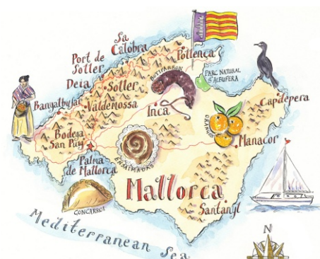
Mapa de Mallorca on apareixen alguns dels estereotips que els turistes esperen trobar.

Picornell, C. (1982). La nova toponímia a les Illes Balears. Una aportació als topònims sorgits arrel del turisme. Butlletí Interior [Barcelona]: Societat d'Onomàstica , pp. 86-100.