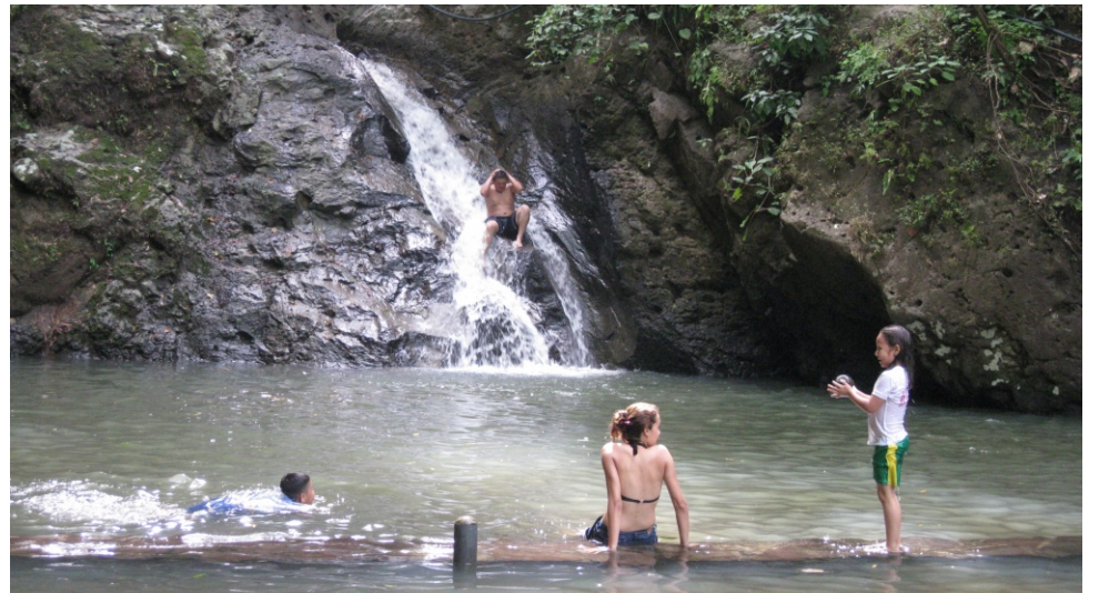
Iniciativa «Bosque de Cinquera», a El Salvador.

Aquesta evolució ha fet que l'oferta comunitària pogués formar part de les noves tendències turístiques internacionals. Aquest fet ha facilitat que moltes comunitats veiessin com s'incrementaven les seves possibilitats de negoci i, al mateix temps, incrementar els ingressos de les seves iniciatives. Simultàniament, però, les grans operadores turístiques mostren un creixent interès per aquesta modalitat de desenvolupament turístic. Això suposa una nova font de reptes i riscos i de qüestionament de com s'organitza l'activitat turística per poder fer front a les seves particulars demandes.