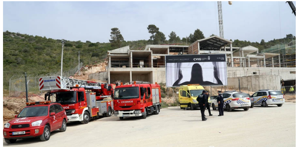
Un dispositiu contra els suïcidis es desplaçà al Park Hyatt de Canyamel el passat dia 16 d'abril.

Si els treballadors de les plantilles hoteleres ja saben de fa estona que és això de