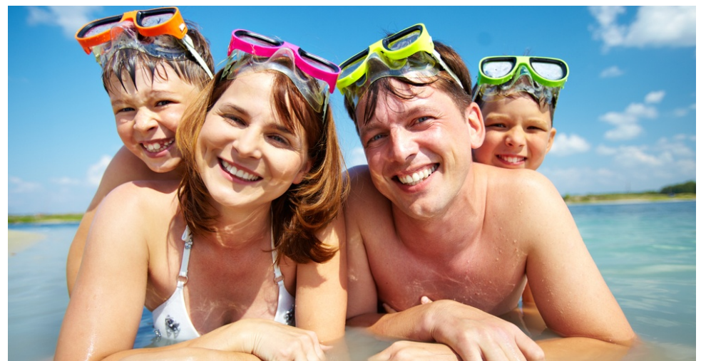
Família «made in capitalisme».

A més a més, altres mecanismes de caire sociològic han anat influïent per fer de l'experiència turística una necessitat. En