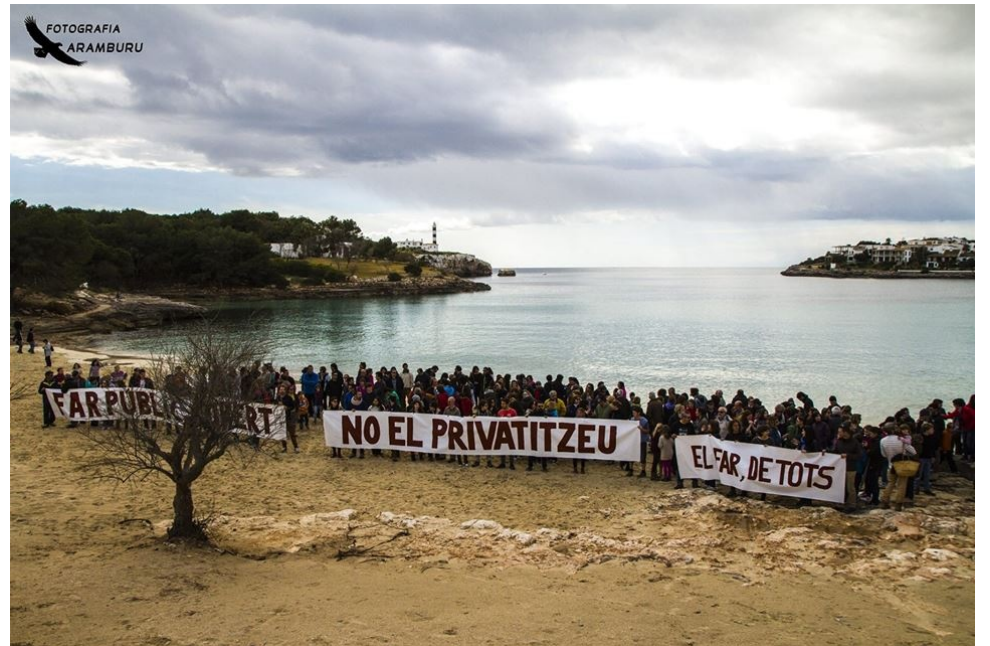
Manifestació del 15 de març. 800 persones marxaren en defensa del far de Portocolom.

Per altra part l'APB és un organisme que mou quantitats ingents de doblers i té un pressupost enorme. Sols al port d'Eivissa fa obres per valor de 12,5 milions d'euros