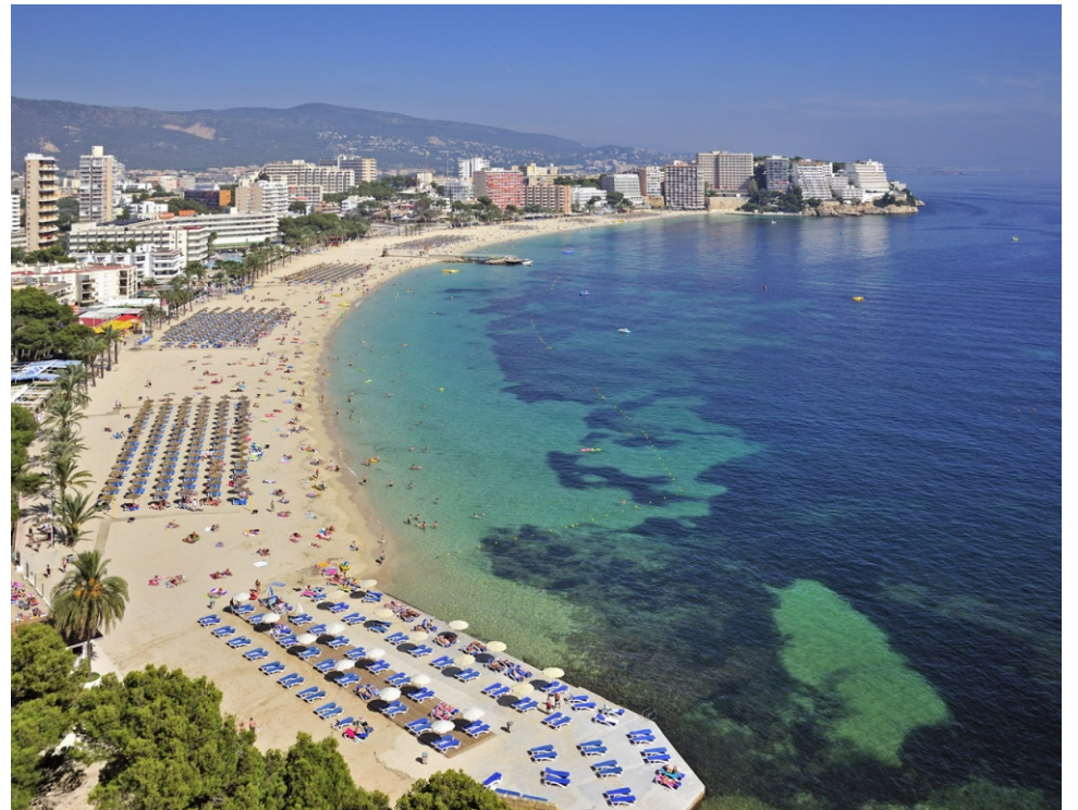
Calvià Beach Resort és el nou nom que es vol donar a Magaluf, després d'haver promogut una campanya de desprestigi del turisme de classe obrera.

I és que els hotelers han dominat el negoci com una oligarquia, aliats amb els règims polítics i els capitals transnacionals dels operadors turístics. Amb l'actual crisi, han reprès el seu interès per les nostres illes, tornant de la seva expansió global que començaren als anys 1980. L'explicació del seu renovat interès per invertir a les Illes Balears la podem trobar en la inestabilitat política, l'encariment energètic i el retraïment de la demanda turística. En aquest context, les inversions immobiliàries a les Illes Balears mostren més rendibilitat i seguretat, ben defensada per l'Euro i l'OTAN. Altres (des)regulacions van en la mateixa línia de mercantilitzar territori, mitjançant mecanismes per aconseguir: legalitzar xalets a foravila, afavorir l'ús turístic d'habitatges, promoure més creixement urbanístic exprés amb «declaracions d'interès autonòmic», eximir les «zones turístiques madures» de les limitacions al creixement que imposa el planejament, ampliar ports