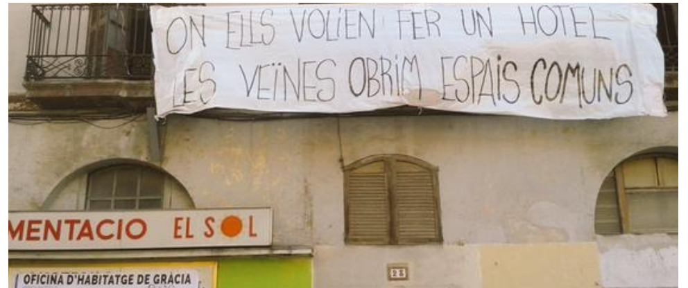
Okupació del local on estava projectat un hotel de la cadena NH (Plaça del Sol, Gràcia).

cap a on vas 4 . A més, en l'àmbit de barri i com a espai-paper de coordinació, recentment ha sortit la publicació en paper gratuïta i autogestionada La Metxa . És evident que una acció d'aquesta envergadura no podria plantejar-se amb èxit sense aquest teixit social de barri.