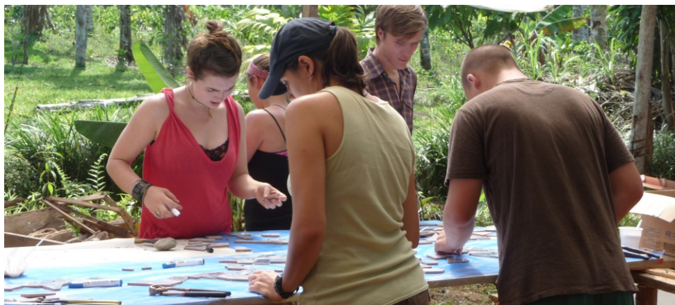
Iniciativa ASOPROLA, Costa Rica.

Un dels principals atractius d'aquesta modalitat turística ha estat la possibilitat de conèixer àrees rurals, allunyades dels grans circuits turístics més massificats, de la mà de la gent que viu en aquells territoris. Gràcies a l'evolució del mercat turístic internacional aquesta és una opció que connecta cada cop més amb els interessos d'un segment creixent del mercat. El model turístic tradicional de caire fordista, que podríem exemplificar amb el típic ressort de tot inclòs, no desapareix en aquest context, però actualment hi ha una demanda en ascens per a propostes turístiques més singulars, personalitzades i que permetin viure experiències considerades com a més «autèntiques». Hi ha una progressiva segmentació de l'oferta turística que s'allunya de l'estandardització de les darreres dècades.