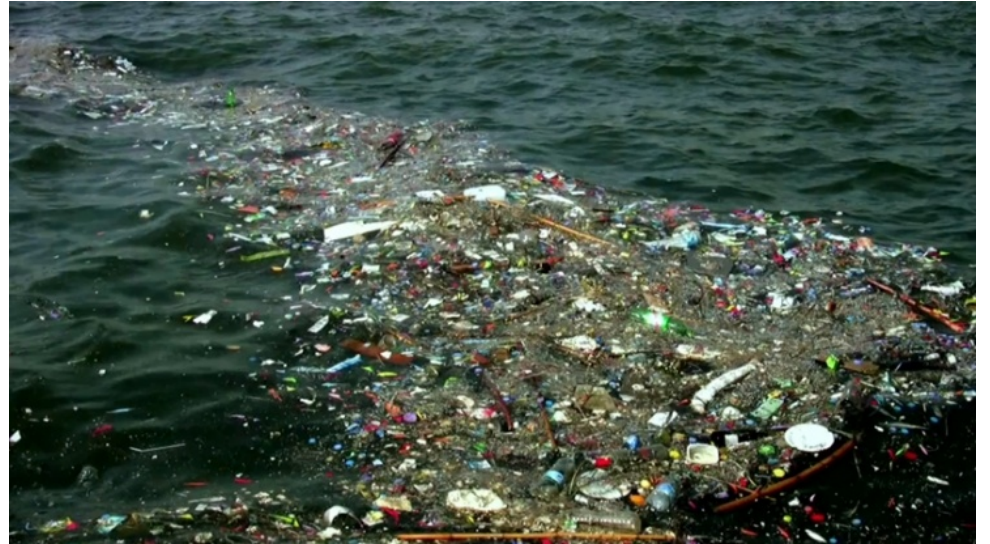
Llengua de fems de fins a 8 milles nàutiques sense interrupció que fou fotografiada l'any 2013 enfront de les costes de Sa Ràpita, Es Trenc, Es Carbó, Es Caragol i cap de ses Salines.

No obstant això, les damnificades d'una contaminació per residus sòlids urbans del medi marí no es redueixen al sector turístic i hotelier, ni a una economia moguda i activada per les persones que ens visiten. Les raons que haurien d'accionar la neteja del nostre litoral han de ser més profundes i han de respondre a la visió del medi marí i dels seus ecosistemes com un patrimoni digne de preservar, atresorat per multitud d'espècies amb funcions ambientals diverses que atorguen bellesa i singularitat a les nostres platges. La posidònia –hàbitat sense el qual no tindríem les platges d'arena blan-