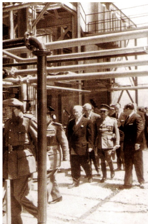
Franco a la inauguració de la central tèrmica d'Alcúdia (1960).

La recomposició del capitalisme després de la II Guerra Mundial s'articulà sobre l'expansió de la societat del consum de masses, que en gran mesura significà l'expansió i reconversió del conglomerat industrial i militar. El transport es convertí en un dels eixos centrals de l'acumulació i erigí l'automòbil com el principal símbol de l'època. A més, el sector aeronàutic fou un dels principals nínxols de negoci, tot reciclant aeronaus, pilots i aeroports militars en civils. Parlar d'aeronàutica, però, significa parlar de turisme. En poc temps el nombre de passatgers arribats a les Balears es multiplicà, tot passant de 6.000 passatgers arribats en avió el 1945 a 4,56 milions el 1973, l'any de la crisi del petroli. L'altre sector que es convertí en el rei del capital fou el dels hidrocarburs, les grans multinacionals del petroli definiren la geopolítica i geoeconomia internacionals. A la dècada dels 1960 el consum mundial de petroli ja superà el de la resta de combustibles i el 1973 se situava en torn a 56 Mbd 1 , dels quals el 45 % estava destinat a alimentar el transport global. Cal advertir que el preu dels combustibles