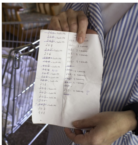
Llista d'habitacions a fer net durant una jornada d'una cambrera de pis.

També puja la contractació a través d'Empreses de Serveis, subcontractades pels hotels. Això implica en molts casos l'acomiadament total o parcial de les treballadores del departament de pisos i la seva substitució per treballadores contractades a una altra empresa que, a més, ja no estan sota el conveni d'hoteleria corresponent, sinó que es regeixen pel conveni de neteja o per un conveni específic d'empresa. Aquest canvi implica entre altres coses que les treballadores, per fer una mateixa feina, puguin estar cobrant al mes 200, 300 o 400 € menys. També suposa un clar debilitament de la capacitat d'organització sindical de les treballadores, quan en un centre de treball podem trobar que una part de la plantilla pertany a una, dues, tres o més empreses.