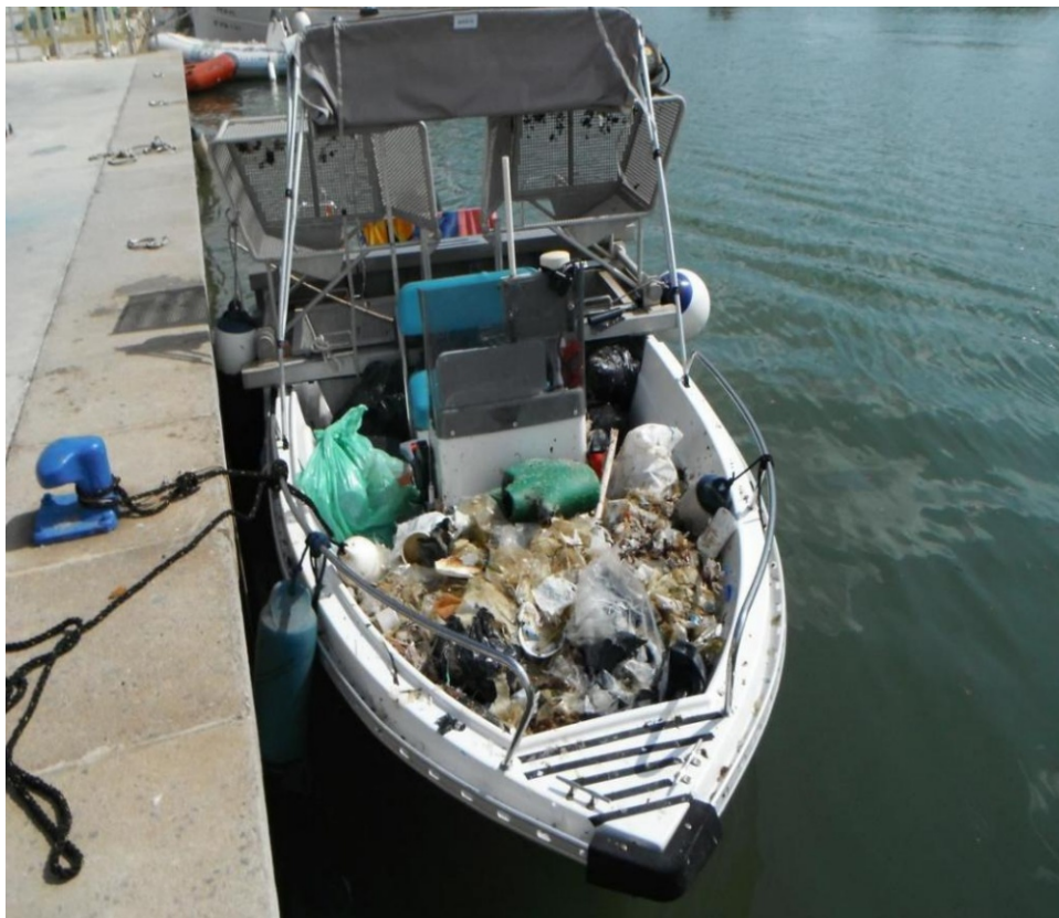
Barques que per poc que bufi el vent o l'embat es tornen insegures.

Totes les raons que s'han enumerat anteriorment són més que suficients per a justificar l'articulació d'una gestió de neteja i conservació del medi marí molt més dilatada al llarg de l'any i que parteixi de la voluntat de millorar el benestar de les comunitats vegetals, animals i humanes que es donen la mà i conviuen en l'espai de les illes Balears. La mar és un medi molt valuós i convé superar la visió economicista que es té de la seva gestió en l'àmbit de les Balears, obcecada fins ara a millorar la imatge de les illes a l'exterior per treure'n només rèdit econòmic.