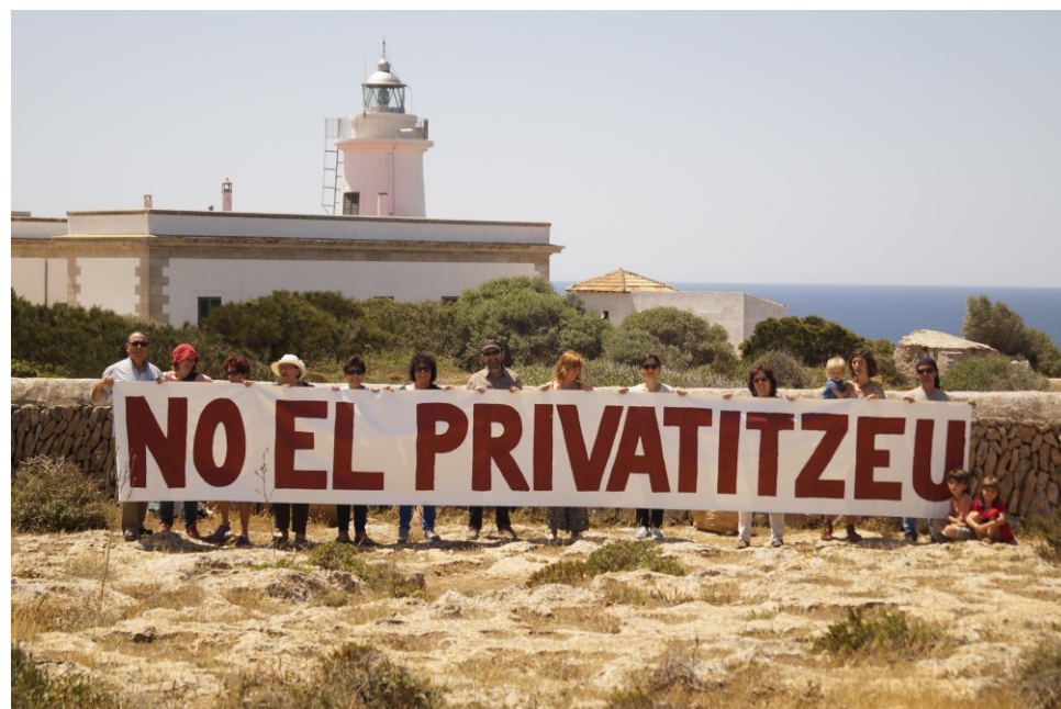
Concentració al far del Cap Blanc contra la seva privatització.

Salvem Portocolom no demana la lluna, sols conservar el patrimoni de tots. Ara també ha reviscolat l'Associació d'Amics dels Fars, que ha iniciat una campanya en defensa dels fars de les Illes. Som-hi idò, que no ens prenguin el que és de tots.