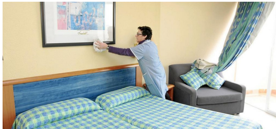
Les treballadores que no participen de la bauxa i el luxe d'Eivissa.

La factura comunitària d'alimentar cegament el creixement turístic i residencial comença a ser impagable a destinacions com Eivissa. La distància entre els superrics d'aquí i de fora s'extrema. L'1 % que se n'aprofita descaradament té a la seva disposició els grans mitjans de comunicació locals amb què mostrar a la població colonitzada i aculturitzada què ha de pensar. Per exemple, aplegats pel Banc de Sabadell i Diario de Ibiza, recentment bona