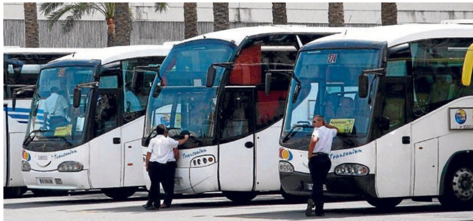
El transport de turistes en carretera també és una feina temporal i amb una altíssima realització d'hores extra.