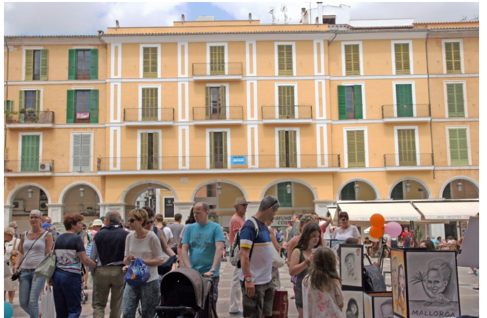
El casc antic es torna intransitable i s'encareix per a viure-hi degut al trànsit de creueristes i al lloguer turístic d'habitatges.

als 220 € per nit. Si baixam a 150 € per nit, arribam a 28 lloguers; a 100 €, 72 lloguers, i a 50 € per nit, uns 300 lloguers. Aquests preus suposen una competència directa als hotels urbans de l'interior de la ciutat; a més a més, fan dels habitatges elements purament especulatius.