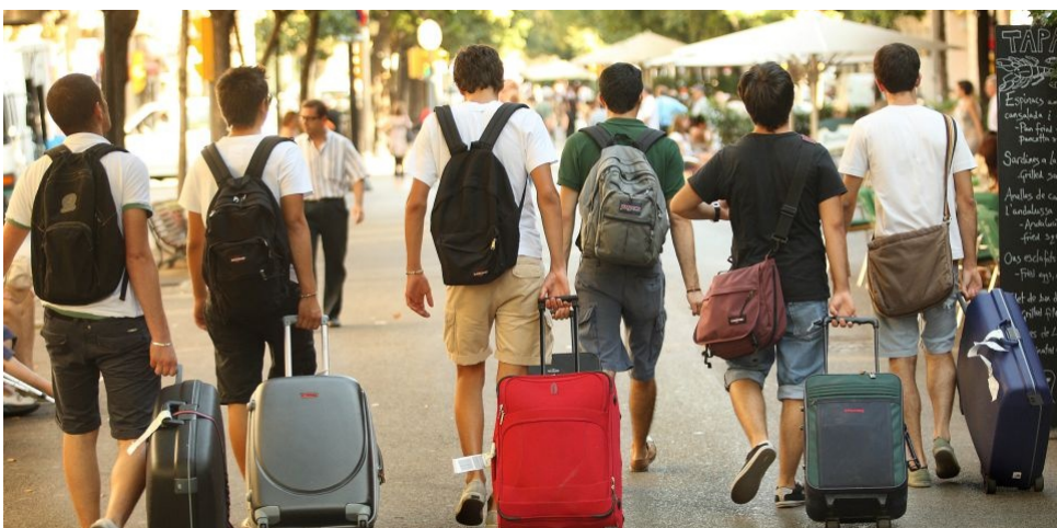
Turistes a La Rambla de Barcelona, on Airbnb concentra bona part de l'oferta.