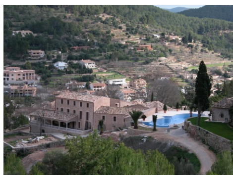
Fora vila es farceix de xalets per a lloguer turístic.

En tot cas, si contrastam aquestes dades amb la web més clàssica i famosa per al lloguer d'habitatges turístics, ens trobam amb les dades següents: 796 habitatges per a 2 persones; si introduïm com a paraula clau «centre», més de 387 corresponen al centre de Palma o al barri antic. Dels habitatges localitzats al centre només 4 es lloguen per un preu superior o igual