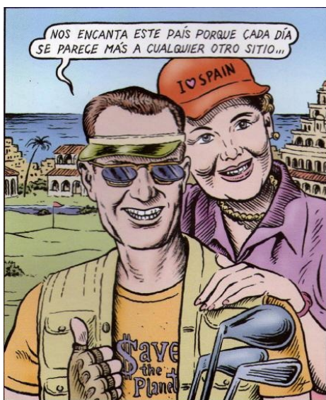
El Sistema uniformitza pensaments i paisatges.

Com molt bé han investigat Ivan Murray i Joan Buades, aquesta primera expansió de la indústria turística ve impulsada per la tutela política i econòmica dels Estats Units en la vella Europa. Per exemple, a l'Estat espanyol són aquestes directrius (Pla d'Estabilització Econòmica) les que animen al franquisme a fer d'Espanya una de les principals receptores d'aquesta incipient indústria. Així, durant els anys 60 els turistes que visiten les costes de l'Espanya feixista ja es comencen a comptar per milions. Per contra, en aquells mateixos anys, i en brutal paradoxa, és quan s'inicia la gran emigració d'espanyols als països d'Europa d'on provenien gran part dels turistes (segons xifres oficials de l'Institut Espanyol d'Emigració (IEE) entre 1959 i 1973 emigraren al continent europeu 1.066.440 persones). A més, és en aquesta mateixa dècada quan es produeix l'immens èxode rural cap a les ciutats i