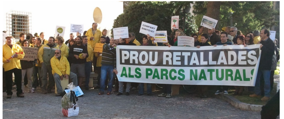
Els acomidaments de l'empresa pública Espais de Natura Balear al 2012 deixà parcs en situació extrema: el Paratge Natural de la Serra de Tramuntana passà de disposar de 6 tècnics a sols 1.

Els primers experiments del Pla Balears Natura 2015 per tal de determinar la potencialitat econòmica de determinades ofertes, lògicament, es feren arriscant el patrimoni públic. Així, el juny del 2012 l'empresa pública Espais de Natura Balear (ENB) establí el pagament per l'assistència a visites guiades i tallers als parcs i reserves, quan fins aleshores havien estat gratuïtes. Igualment, es fixà el pagament per a l'entrada a centres d'interpretació. Sota la premissa del llavors gerent d'ENB que «la gent que realment vol gaudir de l'espai està disposada a pagar», els efectes d'aquesta mesura-experiment foren nefastos, amb una caiguda gravíssima de la participació ciutadana en les activitats dels parcs. Al Parc Natural de s'Albufera de Mallorca, el nombre de visitants passà de 677 persones el 2011 a 191 el 2013 (reducció del 73 %), desincentivant-se així greument la implicació social en la conservació del parc. També a s'Albufera, l'any 2012 només pagaren l'entrada al centre de Can Bateman 188 persones (menys d'un 3 per mil dels 65.963 visitants que passaren pel centre d'informació). Resultats nefastos econòmicament i social.