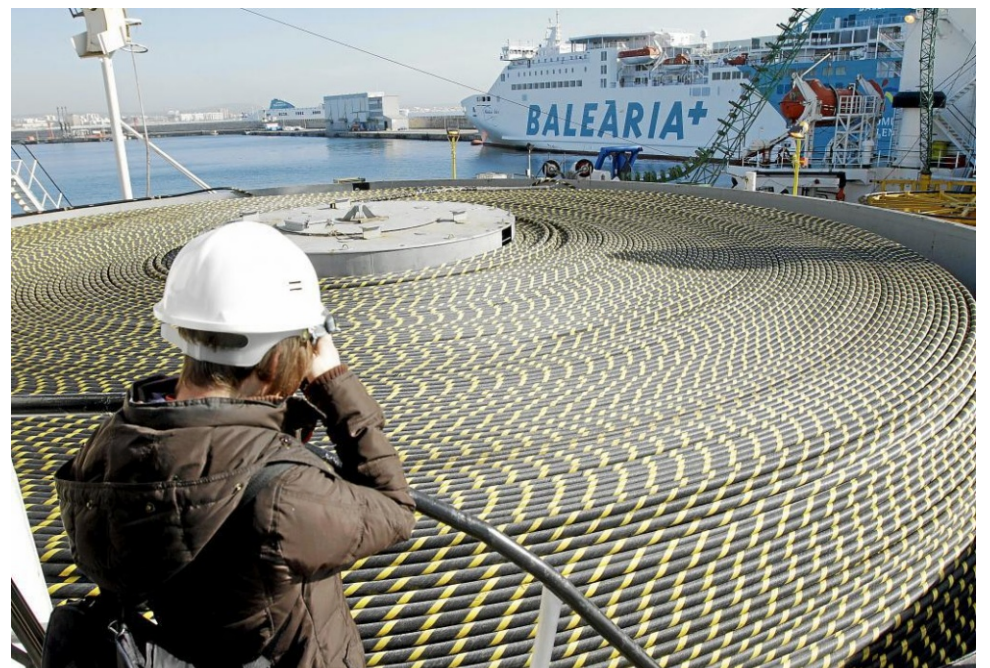
La darrera gran infraestructura energètica: Projecte Rómulo d'interconnexió elèctrica entre la península i les Balears (400 MW) en funcionament des de 2012.

Emperò no és només el transport aeri el que es potencia i subvenciona, sinó que les zones turístiques també s'han hagut d'adaptar, en termes energètics, per tal d'acollir els usos de la indústria del plaer. L'adaptació energètica d'aquests espais ha estat una prioritat per part dels governs «proturístics» des que la dictadura designà el territori balear com el principal jaciment turístic espanyol. A la primera meitat del segle XX les Balears estaven escassament electrificades i el control elèctric estava estretament vinculat amb els grans cacics: March a Mallorca o Matutes a Eivissa. Així mateix, els poderosos controlaven també els combustibles: March amb el complex petroquímic de