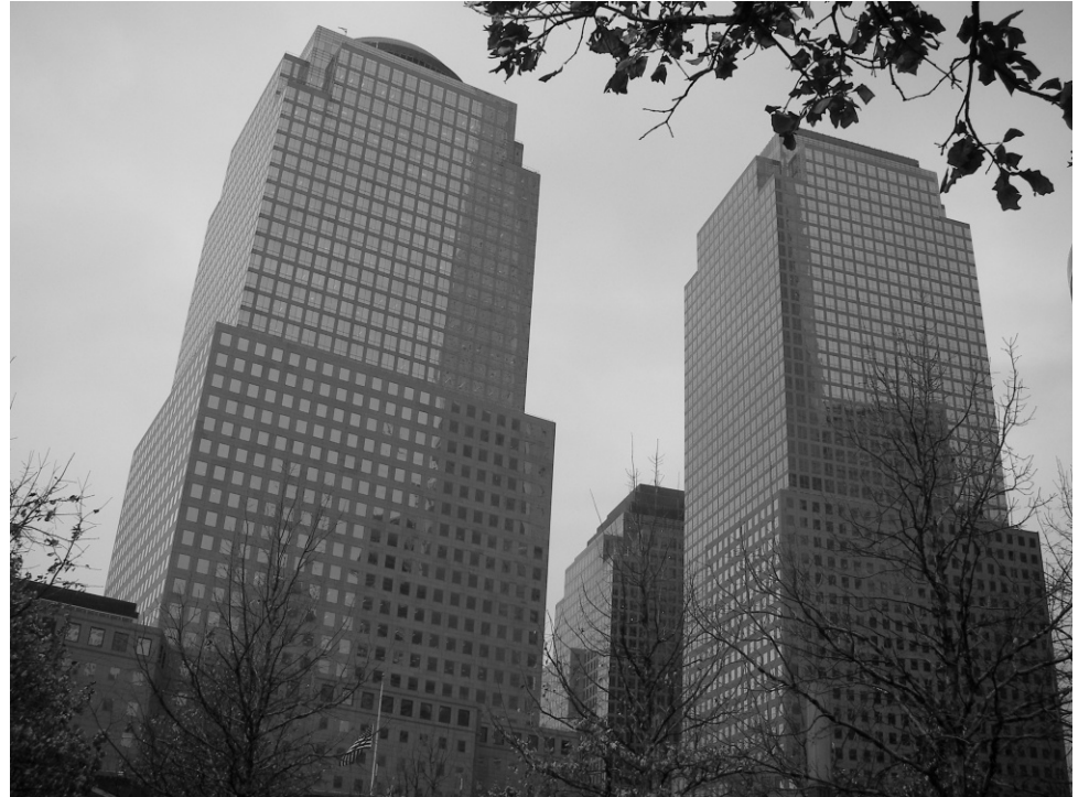
La rellevància ecològica dels organismes productors i descomponedors a les ciutats contemporànies és escassa.

Un altre aspecte que, com a ecòleg, em crida l'atenció és l'ínfim paper dels descomponedors en els sistemes humans,