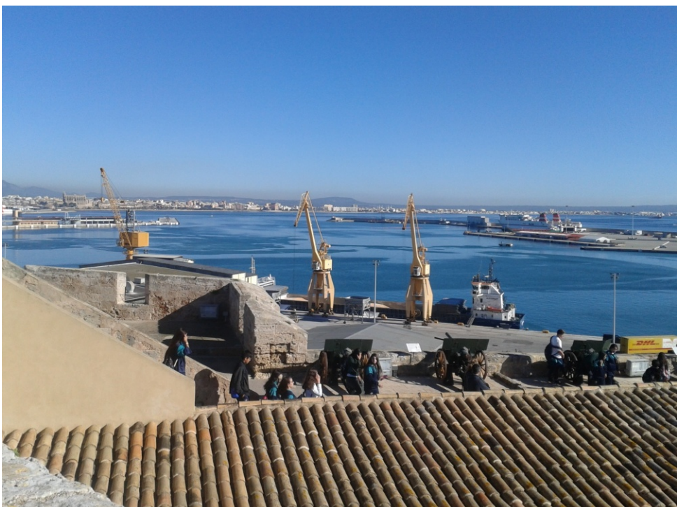
El principal recurs que alimenta l'ecosistema socioeconòmic balear arriba de fora, pels ports i aeroports, i ens fa ser totalment dependents d'ell.

cercar uns altres recursos tròfics (altres espècies per alimentar-se) o bé s'extingiran com a població. De la mateixa manera, el nostre ecosistema humà es basa per sobreviure en un recurs principal, el turisme, que ens aporta la matèria i l'energia (en aquest cas en forma de beneficis econòmics) que necessitem. Si algun dia aquest recurs extern deixa d'aparèixer o en disminueix la seva magnitud, com podria passar amb el plàncton de l'exemple anterior, l'ecosistema s'extingirà i l'espècie dominant haurà de seguir un dels tres camins abans explicats. S'ha de tenir en compte, emperò, que els turistes no són exactament com el plàncton que apareix a l'ecosistema i és devorat per altres espècies. Els turistes són el principal recurs econòmic del nostre ecosistema però són un recurs que temporalment conviu amb nosaltres dins l'ecosistema i, per tant, també en consumeix els seus recursos, entrant en competència amb els organismes residents. Això provoca, com sabem, que la demanda d'energia i aigua a les Balears durant la temporada turística augmenti considerablement. De la mateixa manera, la taxa de generació de residus també augmenta. Així, resulta que el recurs que ens «alimenta» econòmicament, es comporta ecològicament com una nova població que es nodreix dels cicles de matèria i energia del mateix ecosistema. Tota una paradoxa ecològica.