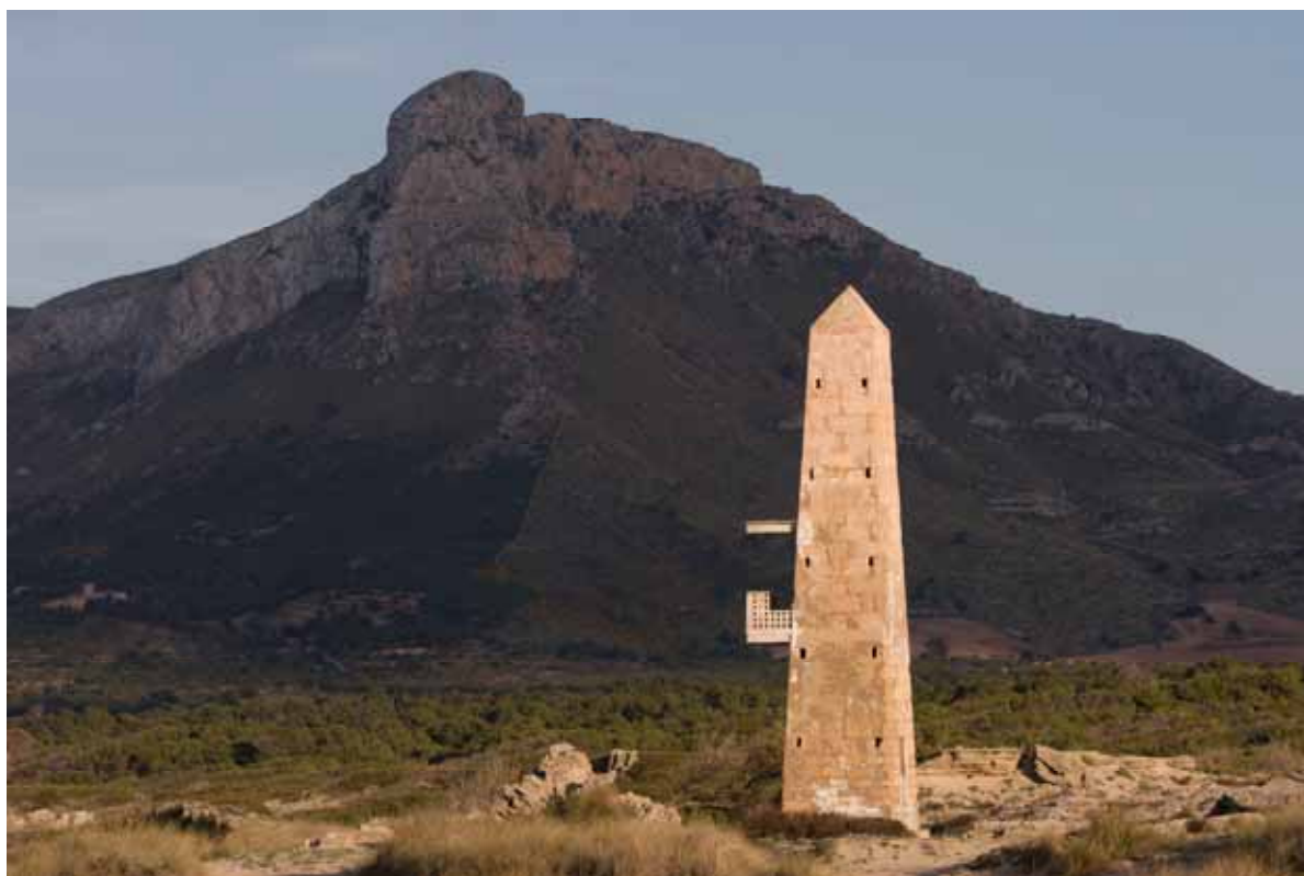
Sa Canova: espais protegits fa 25 anys podrien ser urbanitzats

Llei d'urbanisme "sostenible" . Una llei que sota la paraula "sostenibilitat" amaga la desprotecció del sòl rústic deixant-lo lliure i apte per a urbanitzar, implica una amnistia als infractors urbanístics i promou la recuperació d'urbanitzacions en espais protegits. Com a conseqüència d'aquesta Llei el Govern ha desprotegit 10 espais naturals a l'illa de Mallorca, 5 d'ells a la Serra de Tramuntana: Monport i Cala Blanca (Andratx), Muleta (Sóller), Cala Carbó i El Vilar (Pollença) i Es Guix (Escorca) . Fins a 104 hectàrees i 10 quilòmetres de zones litorals de gran valor tornen a estar en perill. Es tracta d'una extensió equivalent a la suma dels nuclis urbans de Sóller, Valldemossa, Bunyola, Esporles, Deià, Puigpunyent, Estellencs i Banyalbufar junts.