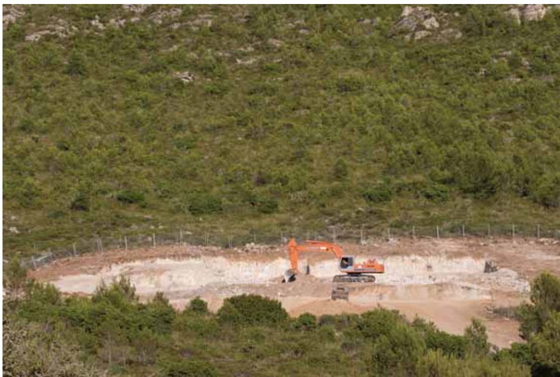
Màquines destrossant l'àrea natural.

Impuls construcció d'un hotel-resort de 5 estrelles de gran luxe, amb capacitat de 142 habitacions i 284 places a Canyamel (Capdepera) , afectant una àrea natural protegida.