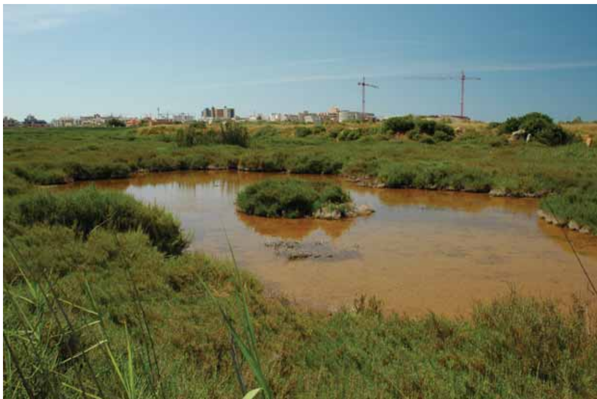
5.000m 2 de zona humida quedaran urbanitzats

Ses Fontanelles: construcció d'un centre comercial a la darrera zona humida de Palma. Tot i que la zona forma part de l'inventari de les zones humides de les illes Balears s'ha vulnerat la protecció i actualment s'hi vol construir un gran centre comercial amb 23 edificis destinats a usos terciaris i comercials i un aparcament amb capacitat per a 2.500 cotxes.