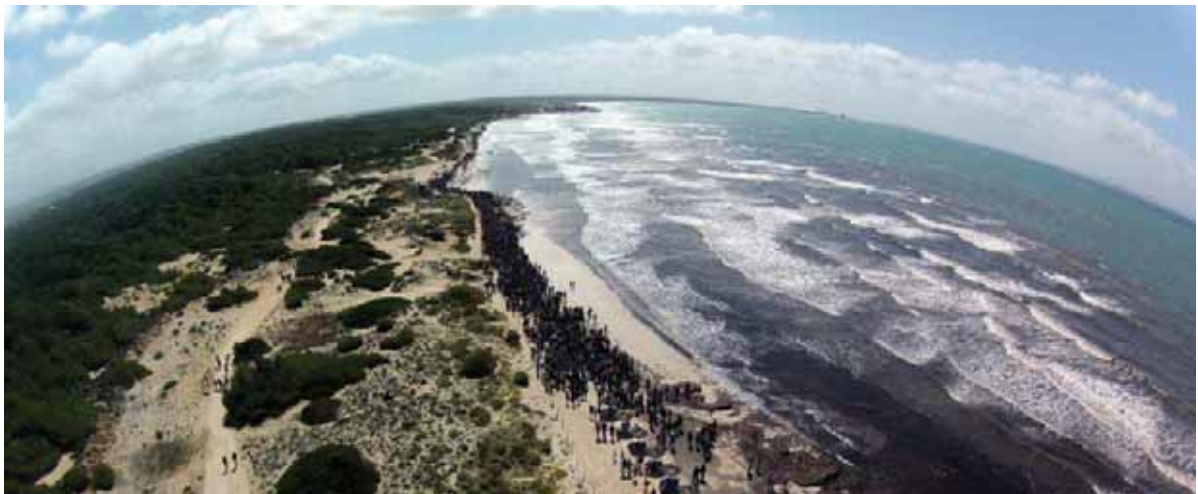
Arenal de sa Ràpita. 29 d'abril de 2012. Cadena humana.

Construcció de l'hotel a sa Ràpita. Projecte de macro-hotel de 1250 places que ocuparia 21 ha, just al costat de l'arenal verge protegit més gran de Mallorca: l' Arenal d'Es Trenc i sa Ràpita .