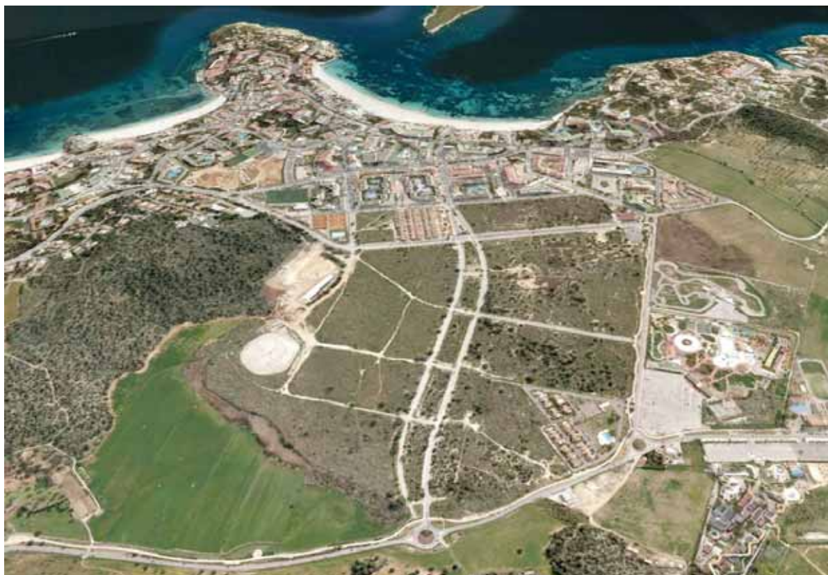
Destrucció d'una àrea natural al costat d'una zona ja saturada

Megacomplexe turístic a la zona humida de la Marina de Magalluf . Declarat d'interès autonòmic per part del Govern de les Illes Balears implicarà destrossar 450.000 m 2 de terrenys i edificar 3.000 places turístiques i residencials, a més de centres comercials i d'oci.