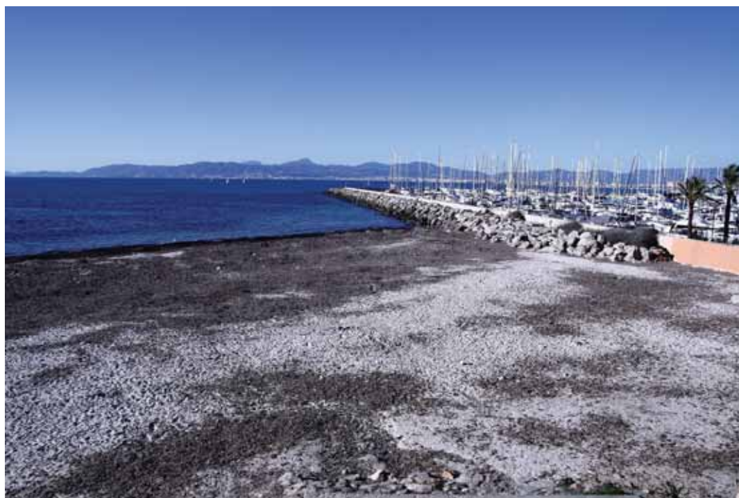
L'ampliació d'aquest port posa en risc la platja de Palma per efectes de l'erosió.

Nous ports esportius: s'Arenal (LLucmajor) . L'ampliació es vol fer sobre 10 hectàrees marines de gran valor ecològic a escassos metres de la Reserva Marina del Cap Enderrocat. El projecte consisteix en la construcció de 155 amarraments per a grans eslores d'entre 20 i 30 metres. La infraestructura suposaria un creixement del 75% sobre les instal·lacions actuals, passant de les 12,3 hectàrees ocupades a 21,7.