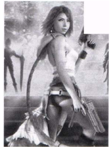
Final Fantasy (Square)

Ahora responde a las siguientes preguntas: