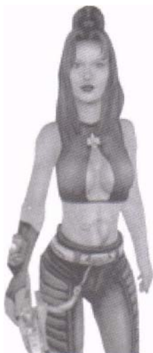
PlanetSide (Verant Interactive)