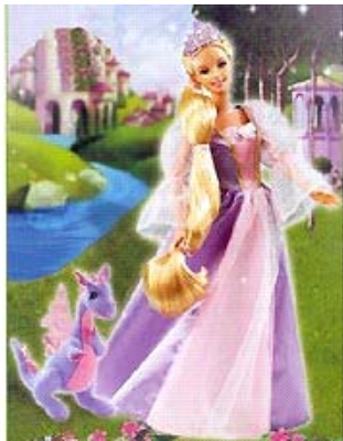
Barbie princesa Rapunzel y Penélope el lago de los cisnes

Observa las siguientes imágenes y descripciones: