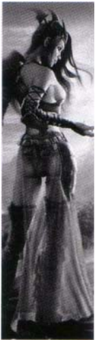
Spell Forcé (Bogwood Productions)