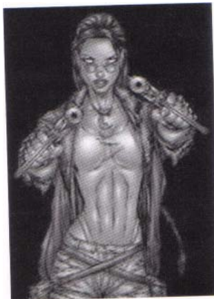
Lara Croft. Tomb Raider (Eidos) BloodRayne (Terminal)