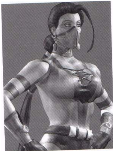
Blood Rayne (terminal)