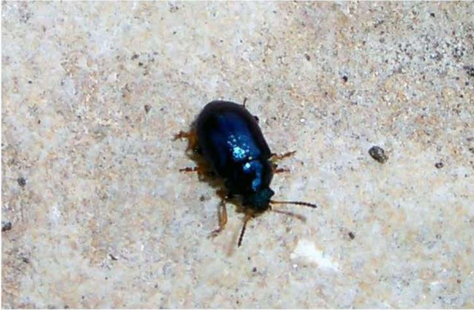
Fig. 2. Colaphellus sophiae (Schaller, 1783).

Balears (municipio de Palma), sugiere que probablemente este crisomérido haya colonizado, por lo menos, algunas otras localidades de la isla.