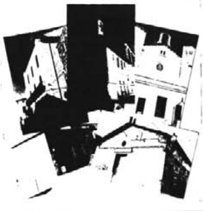
Campanya d'ajuda voluntària 100x1000

ELS EDIFICIS DE LA NOSTRA PARRÒQUIA D'ARTÀ NECESSITEN CONSERVACIÓ I MILLORAMENT