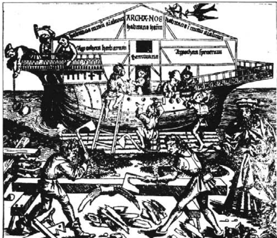
Ilustración de "La Crónica de Nuremberg" que representa la construcción de una carraca. Las carracas tenían menos eslora y más manga que las carabelas y contaban con mayor desplazamiento.

Fray Domingo de Floriania debe pues ser considerado, a pesar de su fracaso, dentro de los precursores de las embarcaciones de ruedas de paletas y por ello y además por su tesón y su vida ejemplar, merece estar entre los hijos ilustres de Artá.