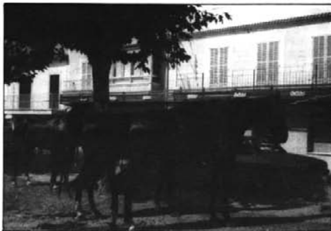
A l'apartat de mancances del nostre poble s'hi ha d'incloure la manca de veterinarí localitzable

Per dissort a l'apartat de mancances del nostre poble, s'hi ha d'incloure la manca de veterinarí localitzable per confirmar el que deim. Malgrat que algú ens pugui penjar l'etiqueta autosuficiencial, ens atrevim, amb el risc que comporten les nostres asseveracions, que els estrais de la paroditis, quasi no afectaren als pollins, perquè una passa epidèmica de paperes, en general, les confereix una immunitat permanent.