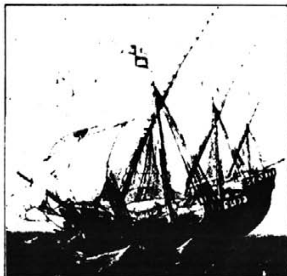
Carabela española del siglo XVI en el puerto de Sevilla.-

Ha publicado los siguientes libros: Molinos Tradicionales (1987). Ingenios y máquinas (1987). Vida y Técnica en el Renacimiento (1987). Mecánica de Fluidos y Máquinas Hidráulicas (1988). El Canal de Castilla (1988). Técnica y Poder en Castilla en los siglos XVI y XVII (1989). Además, 30 artículos en revistas especializadas.