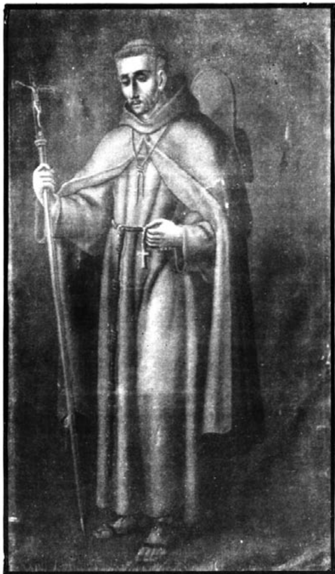
Original en el Museo de San Francisco de Querétaro.

LA ESTATUA SERA REGALADA POR EL ESTADO DE QUERETARO (MEXICO)