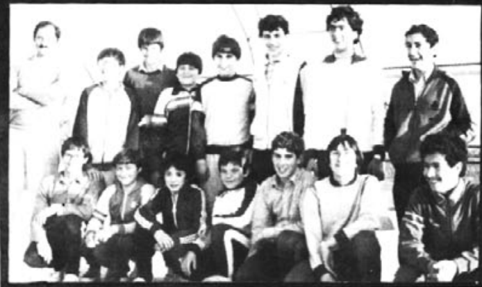
Juniors que han reforçat l'equip senior.