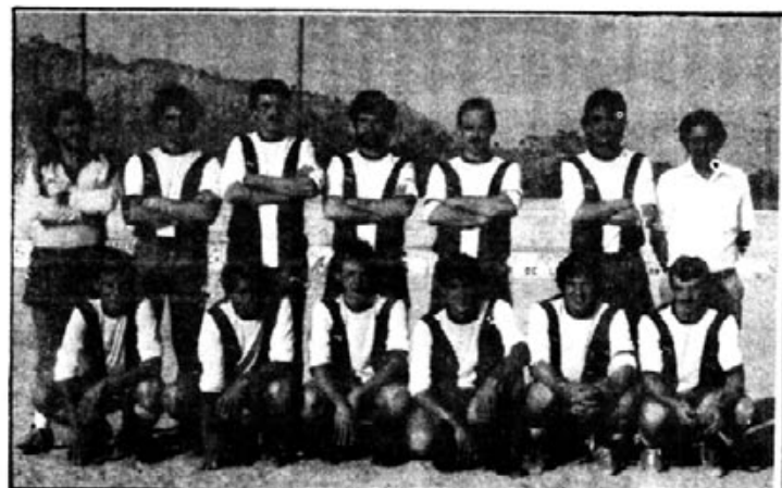
Equipo del combinado comarcal que se enfrentó al Artá (1-4).