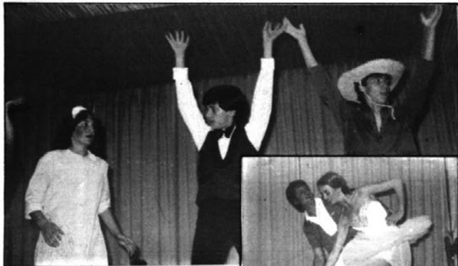
ESCUELA DE BAILE MODERNO

Sortint al pas d'uns comentaris que ens han arribat a les orelles, i a rel del escrit d'aquesta secció del nº 59, 28 de maig, en el que es feia al·lusió al possible netejament i