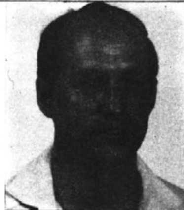
J. Mislata Cuéllar

1.- 1. Entre los hechos positivos destacaríamos: Gestiones realizadas por el Consistorio, y que fructificaron en la conversión del anterior Colegio Municipal Libre Adoptado en el actual Instituto "Lorenzo Garcías i Font".