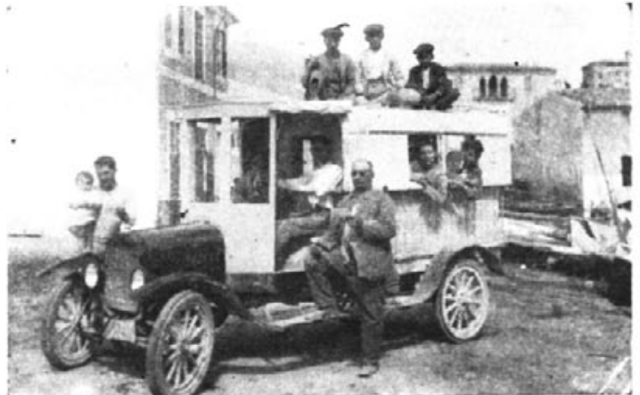
(Primeros autocares que circularon por las carreteras del levante mallorquín)