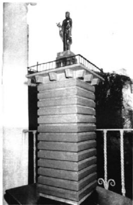
(maqueta del proyecto, ya aprobado, de NA BURGUESA)

Tiempo habrá de ocuparnos de esta nueva obra del escultor Sarasate, que a no dudar constituirá una de sus más importantes realizaciones.