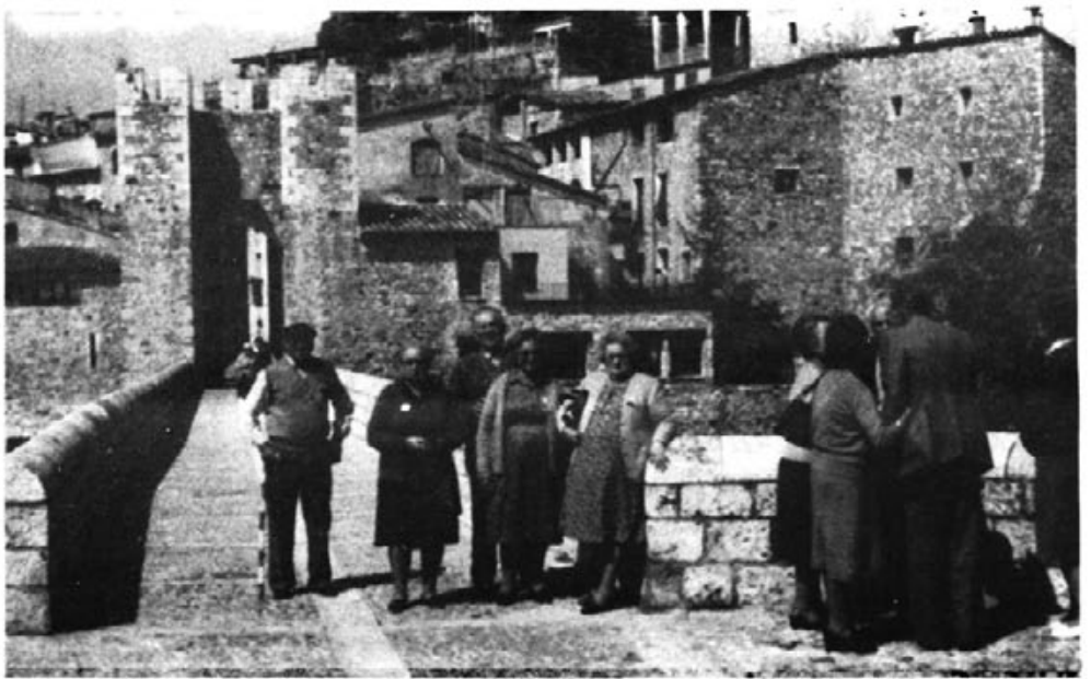
Un grupo de la excursión sobre el puente de Besalú