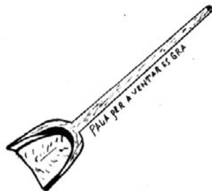
PALLA PER A VENTAR EL GRA

rams d'ullastre o d'aladern ho agraven per si havia quedat gens de gra.