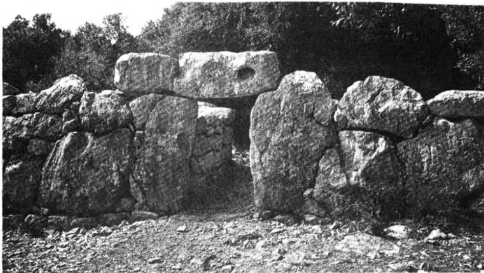
La Junta del Museu Regional d'Artà no conegué aturall fins que Ses Païsses foren propietat del Patrimoni Artístic Nacional.