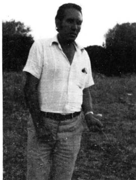
Es verduc sa vincla sense que intervingui sa voluntat.