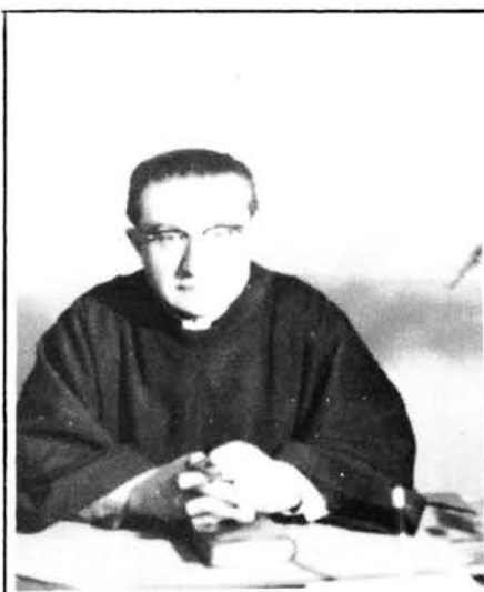
MORI EL P. RAFEL NADAL T.O.R.

Com a cloenda d'aquest estudi i per aportar alguna notícia d'aquest talaiot artanenc, podem dir que els nostres avantpassats de qualque manera manifestaren la