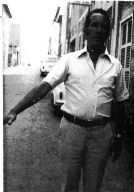
No fa falta varilla. Basta estendre el braç.

—Art i ciència. Això va quedar ben clar en el Primer Congrés de Radiestesistes de Barcelona que es va celebrar els dies vint i quatra i cinc de Juny.